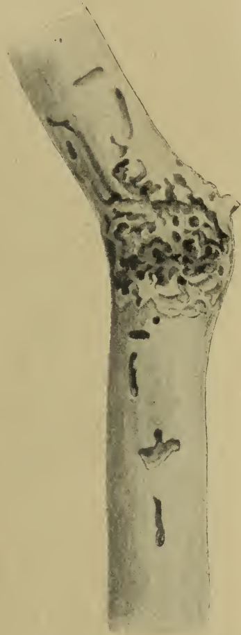
Fig. 2. Brutbild von Liparthrum bartschi an Viscum album .

Die Brutbilder dieser in Istrien (Umgebung von Rovigno, Pola, Insel Brioni) aufgefundenen Art werden von Wichmann in nachstehender Weise beschrieben: „ L. albidum bebrütet die dünnen und dünnsten Teile von Spartium junceum L. Der Gang ist ähnlich angelegt wie bei cholchicum , nur bedeutend kleiner und infolge des dünneren Materials gewöhnlich auch tiefer eingesenkt. Sein Umriß ist länglich rundlich, meist ohne nennenswerte sterile Anhänge. Er entwickelt sich aus einer längsläufigen schmalen Röhre, die allmählich seitlich erweitert wird, bis die zur Unterbringung aller Eier nötige Größe erreicht ist. Die Dimensionen des Raumes sind durchschnittlich folgende: 4—7 mm Länge und 3—5 mm Breite. Die Zahl der Eier schwankt beträchtlich zwischen 15 und 30. Die Einischen sind nur selten aneinander gedrängt. Die Larvengänge greifen sofort deutlich in den Splint ein, bewegen sich gerade in der Zweigachse und werden 1—1,5 cm lang. Die primitiven Puppenhöhlen liegen tief im Holz, im schwächsten Material im schwammigen Mark. Der Jungkäferfraß ist sehr umfangreich und tief.“