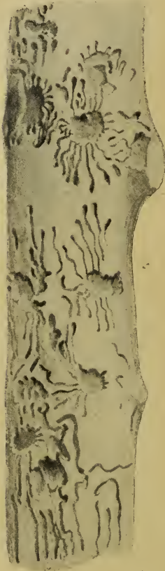
Fig. 3. Brutbild von Liparthrum mori an Morus .

Zur Untersuchung lag mir ein entrindetes, 15 cm langes und 1—1,5 cm dickes Zweigstück von Morus vor, das, wie Fig. 3 zeigt, mit Fraßbildern dicht bedeckt war. Auch hier treffen wir wieder platzförmig erweiterte Muttergänge an, die eine ziemlich regelmäßige quer-