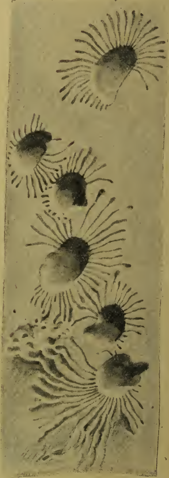
Fig. 4. Brutbild von Dacryostactus kolbei .

Die Fraßbilder dieses afrikanischen, an einer bisher nicht bestimmten Meliacee vorkommenden Borkenkäfers sind von überraschender