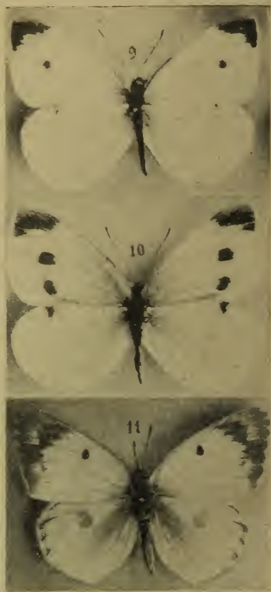
Fig. 9 (♂). Pieris rapae messanensis Zell. (= mannides Ver.) (Dalmat. med., Perkovic, 12. VI. 1908, H. Stauder leg.).

„ 8 desgl. (Calabria, Aspromonte, VII. 1914, H. Stauder leg.).