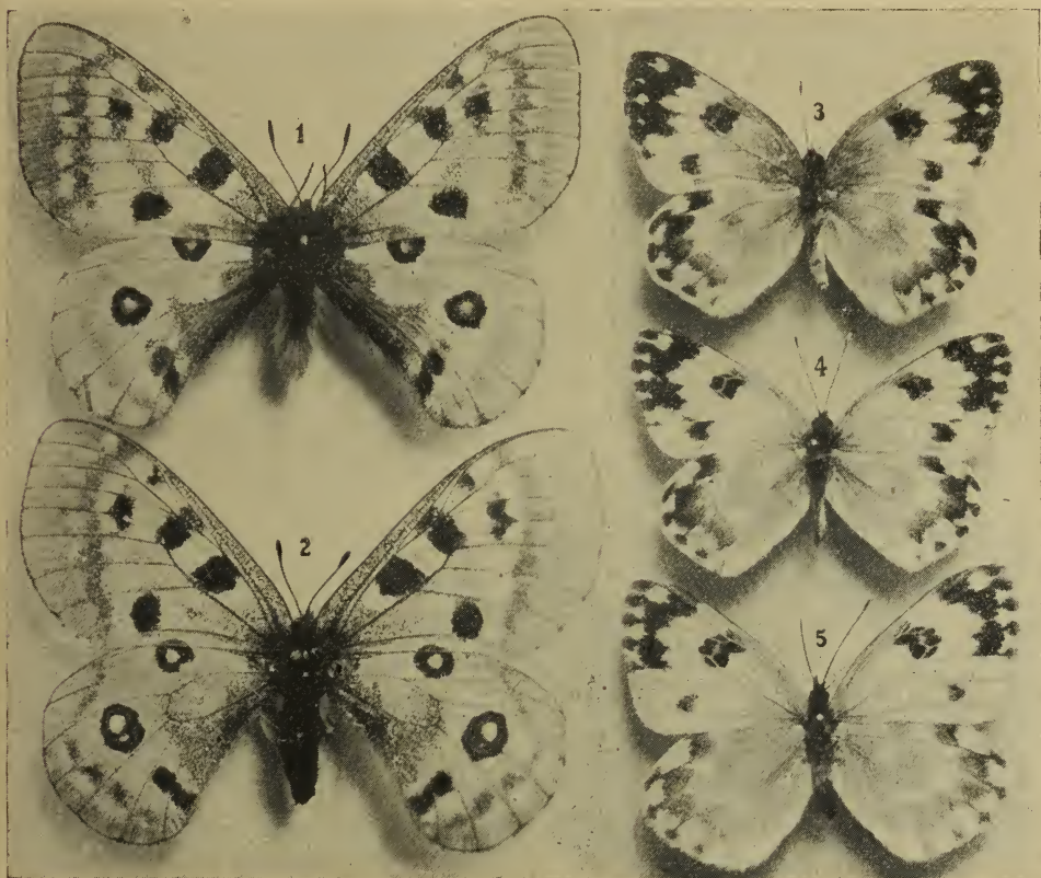
Fig. 1 (♂), 2 (♀). Parnassius apollo trans. ad. form. valderiensis Tur. u. Ver. (Julische Alpen, Trenta-Gebiet, 4. VIII. 1913, H. Staud. leg.). „ 3 (♀). Pieris daplidice f. anthracina Schultz. (Dalmat. med. lit., Spalato, V., 1913, H. Staud. leg.). „ 4 (♀). Pieris daplidice f. nitida Ver. (Triest, 28. VIII. 1912, H. Stauder leg.). „ 5 (♀). „ „ forma (gen. verno-aest-alticola?) (Italia mer., penins Surrentina, Mt. Faio, ca. 1000 m, 8. VI. 1913, Stauder leg.) [ expansa Ver.!).

6. mnemosyne L. Ueber das ganze Gegenstandsgebiet von den Julischen Alpen bis mindestens Mitteldalmatien (laut Mann Biokovogebirge bei Almissa) verbreitet, jedoch ziemlich lokalisiert; so auf der Crna Prst (nach Hafner häufig), auf den Südhängen des Triglavstockes, vom Monte Rombon und dem Canin-Massiv aus beträchtlicher Höhe Ende Juni, vom Matajur (VII), im Bačatale von mir nicht angetroffen, jedoch wohl auch dort nicht fehlend, vom Mrzavec im Ter-