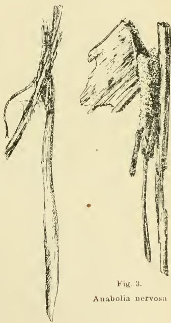
Fig. 2 Halesus species

Fig. 2 zeigt das Gehäuse einer Halesus -Species aus einem raschfliessenden Bach, an deren Köcher ein langer, biegsamer Grashalm gefügt ist, der das Gehäuse wohl nie hätte aufhalten können. Anabolia nervosa kommt bekanntlich in fliessendem wie in stehendem Wasser vor. Fig. 3 gibt ein Gehäuse wieder, das in der denkbar stärksten Weise belastet ist, es stammt aber aus einem seichten, völlig bewegungslosen Tümpel. Die Larve hat sich nicht begnügt mit den gewöhnlichen Schilfstücken, sondern ein massives Stück Holz angefügt.