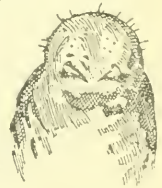
Fig. 2. Kopf der Larve der Syntomaspis pubescens Först. Vergr