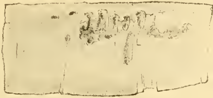
Fig. 2. Längsschnitt eines Mutterganges von Sc. mikado in Acer pictum .

Weibchen; das Männchen befand sich entweder im Frassgang oder in der Eingangsröhre. Der Käfer bevorzugt die drei oben genannten Holzarten und wurde ausserdem von G. Lewis auch auf Aesten der Pflaumenbäume gesammelt. Ich fand ihn am häufigsten auf Acer pictum Thumb. und zwar niemals auf gesunden Stämmen, sondern auf geschwächten oder frisch gefallenen Individuen. So z. B. war ein Ahornbaum, Acer pictum Thumb. in Sapporo anscheinend ganz ge-