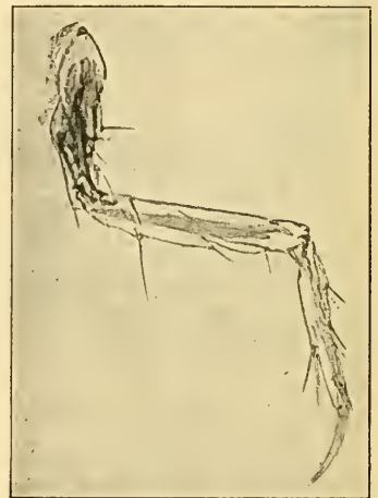
Fig. 17. Bein. 160:1.

Cerci (Fig. 16) verhältnismässig kurz, zweigliedrig, das erste Glied fast zylindrisch, das zweite von gleicher Länge, aber nur \frac{1}{3} so dick,