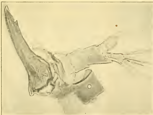
Fig. 13. Oberkiefer, Fühler. Ocellus 150 : 1.

Oberkiefer (Fig. 13) von sensenförmiger Gestalt, die mediane Kante etwas ausgeschweift, die laterale etwas gewölbt, nahe der Basis mit 2 wagrecht abstehenden Borsten besetzt, unterhalb der Spitze steht ein kleines, scharfes Zähnchen; der Gelenkkopf liegt ganz medianwärts, lateralwärts etwas oberhalb der Basis befindet sich eine zweite Gelenk- stelle, eine Aushöhlung mit einem dicht davorstehenden kleinen Gelenk- höcker, in diese Aushöhlung passt ein von den Seiten der Kopfkapsel unterhalb des Clypeus ent- springender Gelenkfort- satz.