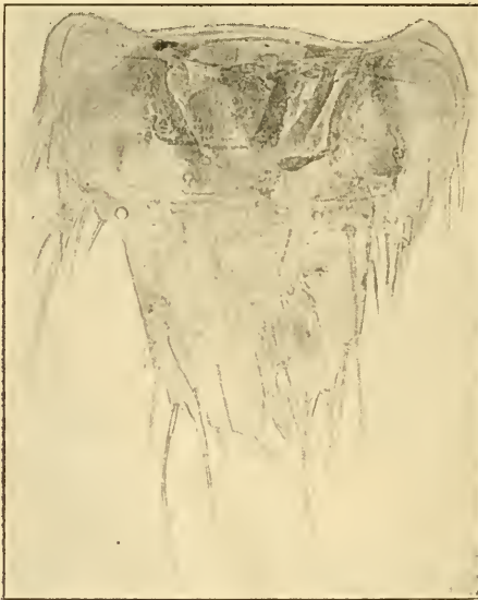
Fig. 16. Abdominalende.

Die Unterkiefer (Fig. 14) mit denen der Larve von Atheta divisa Märkel übereinstimmend. 3 gleich gebaute Beinpaare (Fig. 17), die Hüften weit getrennt, zapfenartig vorragend, Trochanter gross und vollständig, mit etwas abgeschrägter Fläche dem Oberschenkel anliegend. Dieser sehr lang, dem Hüftbein und dem Trochanter zusammen an Länge gleichkommend, Schiene etwas kürzer und schmaler, reichlich mit dornförmigen Haaren besetzt. Klauen sehr lang und spitz, halb so lang wie die Tibia, unterhalb nahe ihrer Basis mit 2 kurzen, abstehenden Borstenhaaren besetzt