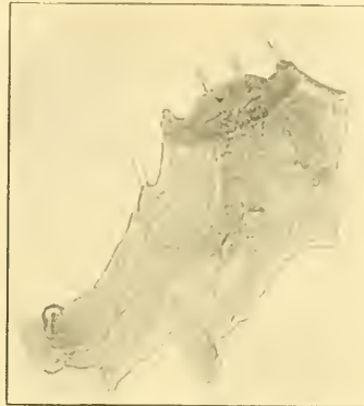
Fig. 12. Kopfschild und Mund- öffnung. 200 : 1.

zeichnete Thoraxstigma liegt ventralwärts in der Verbindungshaut zwischen Thoraxsegment I und II, die 8 sehr kleinen Abdominalstigmata, welche nur im mikroskopischen Präparat sichtbar sind, liegen dorsalwärts, ganz hart an dem Seitenrande der Rückenschiene, in deren oberen Ecke; je weiter nach hinten, desto weiter rücken sie von dem Vorder- rand der Schiene ab. Das 1. Thorax- segment ist fast so lang wie das 2. und 3. zusammen, alle drei Thoraxsegmente tragen eine durchscheinende Mittellinie. Kopf nur wenig vorragend, auf dem Scheitel mit einem V-förmigen Eindruck, jederseits ein grosser, deutlicher, heller Ocellus, etwas von dem Fühler abgerückt. Auf der Unterseite des Kopfes füllen die Stämme der Unterkiefer und der Zungen- träger den Kehlauschnitt vollkommen. Fühler seitlich vorragend, das grosse, helle, nach oben und aussen gerichtete Anhangsglied bereits bei Lupeubetrachtung deutlich zu erkennen.