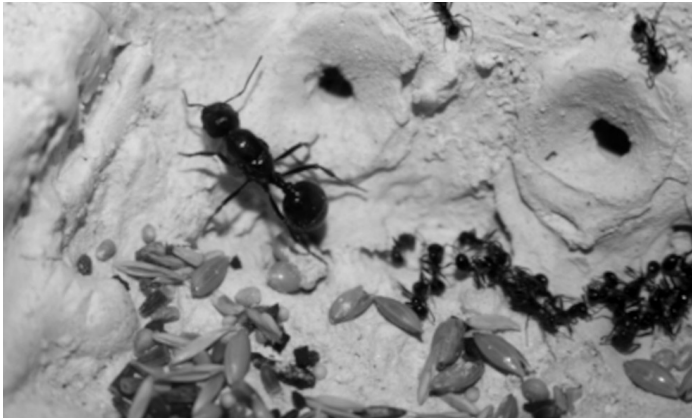
Abb. 2. Königin von Messor capitatus in ihrer künstlichen Königinnenkammer. Durch die beiden engen Tunneln (oben) können nur Arbeiterinnen (rechts im Bild) passieren, Futter bringen und Eier in die Brutkammern abtransportieren.