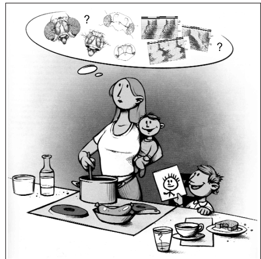
Abb. 1. Über die Unmöglichkeit mit kleinen Kindern und ohne Kinderbetreuung wissenschaftliche Forschung zu machen.

Immerhin konnte ich mit Hilfe meiner Eltern und Schwiegereltern, die die Kin-