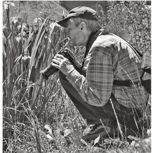
Beim Fotografieren am Floßgraben 2011

Sterba, G., Naumann, W.W., 1966. Elektronenmikroskopische Untersuchungen über den Reissnerschen Faden und die Ependymzellen im Rückenmark von Lamprolaima planeri (BLOCH). Zeitschrift für Zell-