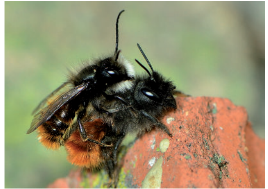
Abb. 5: Gehörnte Mauerbienen ( Osmia cornuta ) bei der Paarung.

2011, nach Hölldoblers Emeritierung, wurde der Neuroethologe Wolfgang Röss-