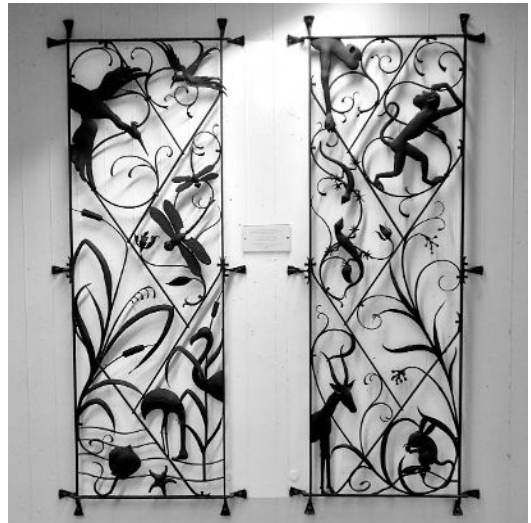
Abb. 1: Kunstschmiedegitter vom Portal des ehemaligen Zoologischen Instituts am Röntgenring 10.

Vaters als „Unikum“, mit Bächlein, Teich und Tropfsteingrotte sowie einem stattlichen Riesensalamander im Aquarium. Ebenfalls Geschichte und weitgehend Parkplätzen gewichen, für viele von uns damals hier Studierende noch sehr präsent, ist der an Reste der alten Stadtmauer angebaute Zoologie-Hörsaal, der auf den Tierphysiologen Hansjochem Autrum zurückgeht (Ordinarius von 1952-1958). Symbolhaft für die Vielfalt des Tierreichs und für die Würzburger Zoologie könnte ein vom Portal des Zoologischen Instituts am Röntgenring ins Biozentrum gerettetes Torgitter (Abb. 1) stehen, entworfen von