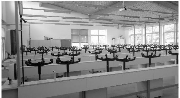
Abb. 2: Einer der großen Biologie-Kurssäle auf dem Campus Nord.