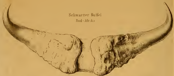
Schwarzer Büffel Sud-Afrika