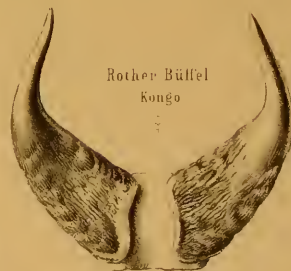
Rother Büffel Kongo