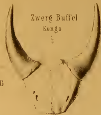
Zwerg Büffel Kongo