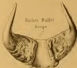
Rother Büffel Kongo