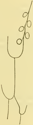
Fig. 2 a.