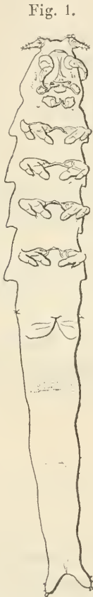
Fig. 1. Männchen von der Bauchseite gesehen.

Im folgenden Cyclopidstadium sehen wir bereits Mandibeln und Maxillen, sowie zwei reich beborstete, doppelästige Fußpaare. In diesem Stadium dürfte die Einwanderung in das Wirthsthier erfolgen. Das kleinste der bisher im Darm von Mytilus gefundenen