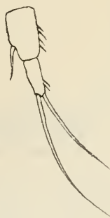
Fig. 1. Canthoc. subterraneus . Hälfte der zwei letzten Abdominalsegmente und der Furca.

Fig. 2. Canthoc. subterraneus . Analoperculum.