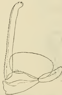
Fig. 10. Ligidium coecum . Letztes Abdominalsegment mit den Uropoden.