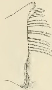
Fig. 7. Canthoc. subterraneus ♂. Fuß des 5. Paares.