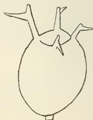
Fig. 1. Saganoarium (?) norvegica (a: \times 220 ; b: \times 340 ). a, Balkengerüst am Pyramidengipfel; P, Pyramidenbalken; g, Gipfelstachel; g_1 , Radialstachel; v, Verbindungsbalken. b, Gipfelstachel.

Fig. 2. Euphysetta Nathorsti Cleve ( \times 220 ).