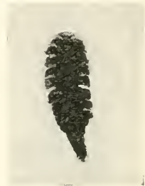
Fig. 3. Abdomen mit seitlichen Anhängen vom Weibchen, stark vergrößert; Rückenansicht. Mikrophotogramm.