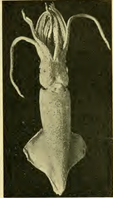
Fig. 1. Watasea scintillans (Berry). ♂ mit dem rechten hectocotylierten Arm. Nat. Größe.

Die Lage der Haken ist ganz ähnlich wie bei dem Weibchen oder dem linken Arm des Männchens. Nur die Zahl derselben ist im allgemeinen etwas niedriger. Gewöhnlich trägt der Arm 10, je 5 und 5. Von 7 Fällen haben wir in zwei 4 Haken an der äußeren Seite des rechten Armes gezählt. In zwei andern, wo man an dem rechten Arm 10 Haken gezählt hat, am linken 12 in einem Fall und 11 in einem andern; bei