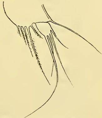
Fig. 2. Moraria muscicola Richters. 1. Fuß. Fig. 3. Moraria muscicola Richters. 3. Fuß. Fig. 4. Moraria muscicola Richters. 4. Fuß. Fig. 5. Moraria muscicola Richters. 5. Fuß.