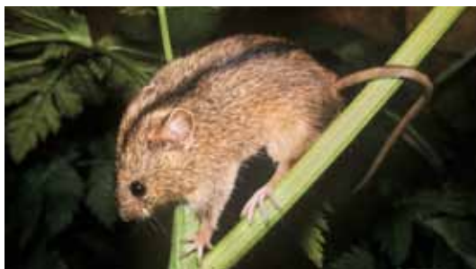
Erst zweimal im Ländle nachgewiesen: Die Birkenmaus