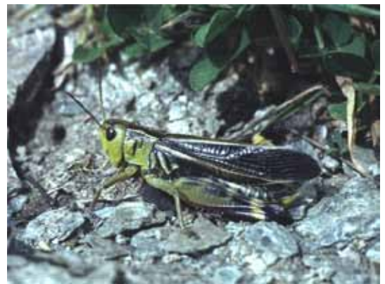
Heuschrecken haben verschiedene Strategien für das Überleben entwickelt.