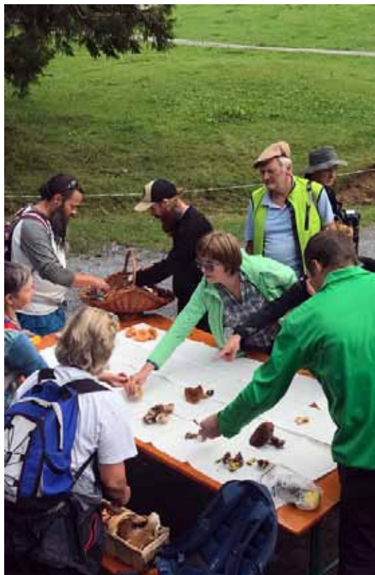
Pilze erfreuen sich grosser Beliebtheit und sind auch ein Dauerthema in unserer Fachberatung. Kurse bieten einen ersten Einblick in deren erstaunliche Vielfalt.

Das Team der inatura darf sich seit Jahren über sehr gute Besucherzahlen freuen. Auch 2018 konnte die Mauer von 100.000 BesucherInnen durchbrochen werden. Wechselnde Sonderausstellungen und die schrittweise Erneuerung der Lebensräume Wasser, Gebirge und Wald in der Dauerausstellung sorgen für Abwechslung und garantieren hohe Attraktivität. Da ist es dann auch nicht weiter schlimm, wenn ein heißer Sommer, mit ungewöhnlich wenig Regentagen dazu führt, dass unsere treuen Besucherinnen und Besucher lieber die Natur draußen genießen. Ganz im Gegenteil! Als naturkundliches Kompetenzzentrum freut es uns sogar. Warum? Nun, weil die breite Bevölkerung nicht nur gerne draußen unterwegs ist, sondern viele Menschen auch wieder ganz genau hinsehen und wieder etwas wissen wollen über die Natur. So erhielten unsere Kolleginnen und Kollegen der inatura-Fachberatung 2018 über 3.000 Anfragen zu verschiedenen Tieren, Pflanzen und Pilzen. Einen detaillierten Bericht zur inatura-Fachberatung finden Sie auf den nachfolgenden zwei Seiten.