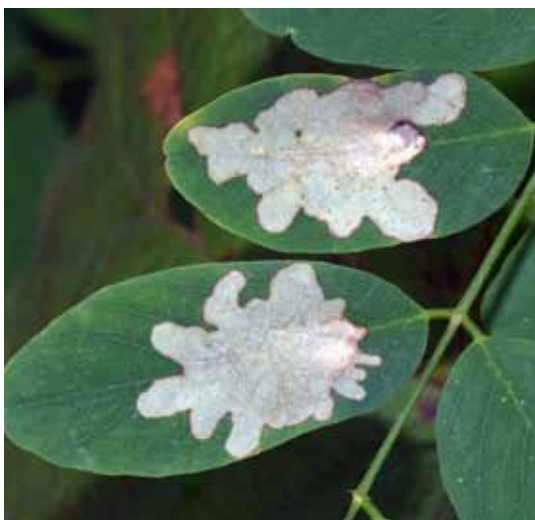
Auch eine Form von Falternachweis: Die Minen der Raupe in Robinienblättern sind der Erstnachweis von Parectopa robiniiella für Vorarlberg.

»Wieso Schmetterlinge?« wird man sich fragen, denn für diese Tiergruppe existiert bereits eine Rote Liste. Doch seit deren Erstellung sind fast 20 Jahre vergangen – 20 Jahre, die auch für die Schmetterlingsfauna Veränderungen gebracht haben. Allein im vorigen Jahr konnten 39 Arten als »neu für Vorarlberg« nachgewiesen werden. Und Arten, die für verschollen erklärt worden waren, sind nach mehreren Jahrzehnten wieder aufgetaucht. Dem steht ein massiver Verlust an Lebensraum gegenüber – Blumenwiesen sind Mangelware geworden, Feuchtflächen werden trocken gelegt, und auch die Änderungen des Klimas haben Auswirkungen für die Falter. In den letzten Jahrzehnten ist die Zahl der Insekten generell dramatisch zurückgegangen. Instabilität von Ökosystemen, Störung von Nahrungsketten und Verlust von genetischen Ressourcen sind die Folge, und somit letztendlich eine nachhaltige Einschränkung der menschlichen Lebensqualität. Damit die Rote Liste der Schmetterlinge auch weiterhin ihren Zweck als Informationsquelle für die interessierte Öffentlichkeit, aber auch insbesondere für Behörden und Gesetzgeber erfüllen kann, ist eine Überarbeitung dringend erforderlich. Die Projektkoordination liegt wieder in Händen von Peter Huemer (Tiroler Landesmuseen, Hall), der weit über Österreich hinaus als profunder Kenner und Experte anerkannt ist.