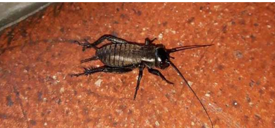
Feldgrille auf Wanderschaft