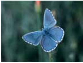
Die Insektenwelt steht auf dem »Speiseplan« im Frühjahr 2019

Frühlingserwachen auf verschiedensten Ebenen wartet auf unsere Schulklassen und Kindergruppen in den kommenden Wochen und Monaten. Neben dem Programm zur aktuellen Sonderausstellung erweckt das Tauwetter auch die Tierwelt wieder zum Leben, was sich natürlich auch in unserem Frühjahrsprogramm widerspiegelt. Die gesamte Palette unserer Jukebox findet sich wie immer in der Heftmitte.