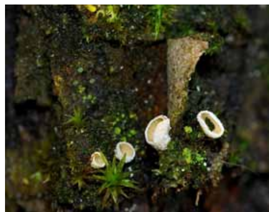
Winzlinge wie dieser Rindenbewohner werden leicht übersehen und sind schwer zu bestimmen.