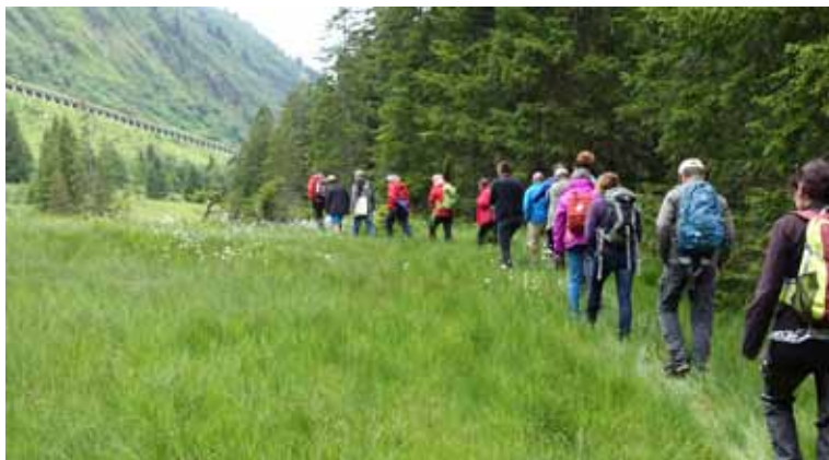
Von Fachleuten begleitete Exkursionen bieten Hintergrundwissen zu den verschiedenen Naturwerten und Landschaften in Vorarlberg.