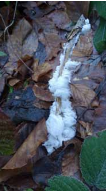
Haareis – die faszinierende Eisformation wird durch einen Pilz ermöglicht.