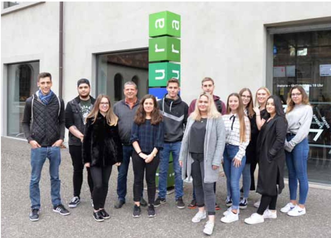
Lehrlinge der Stadt Dornbirn erlebten eine Spezialführung in der inatura