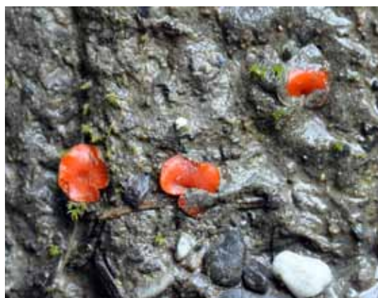
Pilze wachsen (fast) überall – hier auf eiszeitlichen Moränensanden.