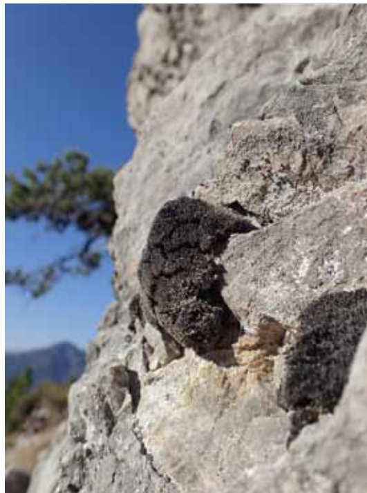
Direkt dem Chemismus des Untergrunds ausgesetzt sind Moose, wie das Rundrippen-Kissenmoos.