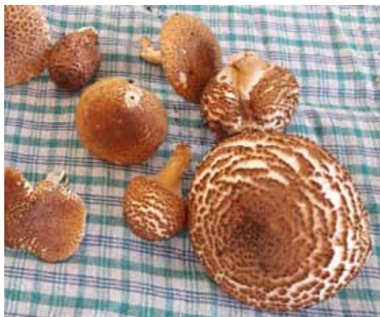
Der leicht giftige Spitzschuppige Stachel-Schirmling lässt sich anhand von Fotos kaum vom tödlich giftigen Igelstachelhäubchen unterscheiden.

Erst vor Kurzem wurde ein Kind nach dem Verzehr von Spitzschuppigen Stachel-Schirmlingen mit Bauchschmerzen ins