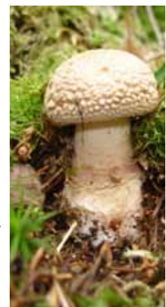
Junge Fliegenpilze sind durchgehend weiß, eine Verwechslung mit weißen Speisepilzen (z.B. Egerlinge) kann fatal sein.

In sehr vielen Fällen ist es Naivität oder Leichtsinns (»mein Opa hat diese Korallenpilze immer gegessen«), die Pilzsammler in Gefahr bringen. Aber auch Experten haben schon am eigenen Leib erfahren, wie schmal der Grat zwischen Genuss und Gefahr bei Pilzgerichten sein kann.