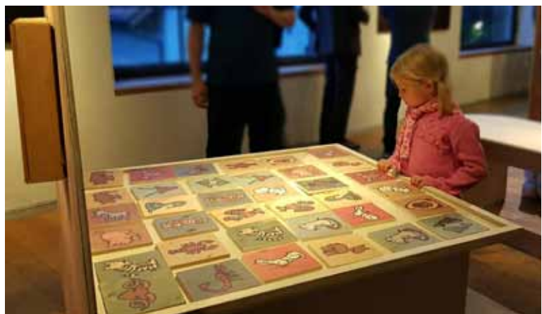
Interaktive Stationen binden die Besucher in die Ausstellung mit ein.