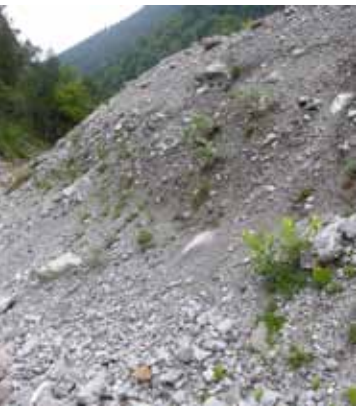
Die Dolomit-Schutthalden des Saminatal sind ein sehr wandlungsfähiger Lebensraum: Jeder Regen kann sie neu gestalten.

Geologie und Botanik sind zwei unterschiedliche, nicht selten inkompatibel erscheinende Welten. Der Geologe wünscht das Grünzeug zum Teufel, denn es verdeckt ihm die schönsten Aufschlüsse. Ja selbst der Boden, Grundvoraussetzung für ein gedeihliches Pflanzenwachstum, ist ihm ein Ärgernis. Er will frisches, unverwittertes Gestein, in dem dessen Entstehungsgeschichte unverändert dokumentiert geblieben ist. Allein schon deswegen ist er dem Botaniker suspekt. Dazu kommt seine Neigung, sich unverständlich auszudrücken, mit Schicht- und Altersbezeichnungen um sich zu werfen, und diese zu allem Überfluss auch selbst nicht immer konsequent-korrekt anzuwenden. Dennoch bleibt ein Botaniker, der über die reine Pflanzenbestimmung hinaus will, auf Wissen um den geologischen Untergrund angewiesen. Das Gestein diktiert den Chemismus, ja gar die Art des Bodens, das Gestein bestimmt, welche Nährstoffe den Pflanzen unmittelbar zur Verfügung stehen. Gestein wie Boden können Wasser rasch ableiten, oder aber auch über längere Zeit speichern. Mit dem Gestein also ändert sich der Bewuchs, und bereits kleine Unterschiede können sich in den Pflanzengesellschaften niederschlagen und sichtbar werden. So könnte das geschmähte Grünzeug dem Geologen helfen, unter dem Boden verborgene Gesteinsgrenzen zu kartieren oder kleine Vererzungen zu entdecken. Das Gestein wiederum liefert dem Botaniker die Erklärung für vordergründige Anomalien im Bewuchs.