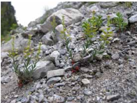
Das Felsen-Steintäschel hat es geschafft. mit dem mobilen Substrat zurecht zu kommen (Foto: Georg Amann).

Das Felsen-Steintäschel ( Aethionema saxatile ) ist eine mediterrane Pflanze aus der Familie der Kreuzblütler. Die bis 20 cm hohe Staude mit unauffällig weißen bis hell rosa Kronblättern lebt in den Alpen hauptsächlich auf dolomitreichem Schutt an wärmegetönten Standorten bis in die subalpine Höhenstufe. In Vorarlberg gilt sie als ausgestorben. Aber gleich jenseits der Staatsgrenze, im liechtensteinischen Abschnitt des Saminatals wurde 1973 ein aktuelles Vorkommen entdeckt. Das Felsen-Steintäschel wächst dort auf dem mächtigen Schuttstrom der Planknerrüfe. In diesem sehr dynamischen Lebensraum wird der Verwitterungsschutt der umliegenden Dolomithfelsen abgelagert, umgelagert und schließlich vom Wildbach abgeführt. Das Felsen-Steintäschel ist dort extrem isoliert: Die nächstgelegenen aktuellen Verbreitungszentren liegen 75-80 km entfernt im Inntal bei Landeck bzw. im Engadin. Die Vorkommen im Wallis sind schon 130 km entfernt, jene in den Berner Alpen 150 km. Auch die Distanzen zu isolierten Einzel-Fundpunkten sind beträchtlich. Dass Aethionema saxatile die Eiszeit an eisfreien Stellen überdauert haben könnte, ist unwahrscheinlich. Wohl eher ist die Pflanze nach dem Abschmelzen der Gletscher von Süden neu eingewandert – auf welchem Weg, lässt sich nicht mehr rekonstruieren.