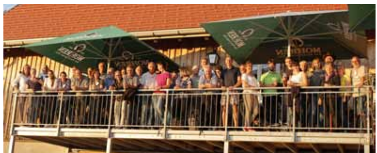
Uriges Konferenzdinner in der Ammenegger Stuba.

Der genaue Termin (im September 2020) wird demnächst bekannt gegeben.