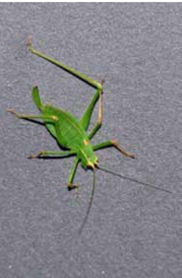
Weibchen der Punktierten Zartschrecke, aufgenommen im Stadtgebiet von Dornbirn. Diese Langfühlerschrecke ist an der grünen Grundfarbe und der dunklen Punktierung erkennbar.

Jetzt in der kalten Jahreszeit sind sie verstummt. Aber ein Sommerabend ohne sie wäre undenkbar. Mit ganz eigenen, für jede Art typischen Gesängen versuchen Heuschrecken-Männchen, im hohen Gras die Weibchen anzulocken und für sich zu gewinnen. Und das kann manchmal auch laut werden. Die Gesänge anderer Arten hört man kaum, oder sie werden vom Tinnitus überdeckt. Dennoch orientiert sich der Heuschrecken-Profi zunächst an den Lautäußerungen dieser Tiere, und nicht wenige Arten lassen sich bereits so eindeutig identifizieren. Wo das menschliche Gehör nicht ausreicht, hilft ein Ultraschall-Detektor, wie er in der Fledermaus-Forschung zum Einsatz kommt. So verwundert es nicht, dass auch der eine oder andere interessante Heuschrecken-Nachweis bei der Fledermaus-Suche gelang. Und doch gibt es auch Arten, die sich der Beobachtung entziehen. Sie leben versteckt und singen nur leise. Erst Zufallsfunde lassen uns die wahre Verbreitung solch vordergründig seltener Heuschrecken erahnen.