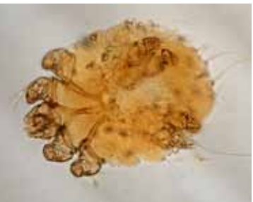
Krätzmilben ( Sarcoptes scabiei ) parasitieren in der Haut von Säugetieren einschließlich Menschen. Sie lösen Krustenbildung und extremen Juckreiz aus.

In den Vorträgen am Freitag wurden neben Krätzmilben und weiteren humanmedizinisch bedeutsamen Milbenarten auch aktuelle Forschungsergebnisse zu Zecken präsentiert. Unter anderem wurden mögliche Folgen der Einschleppung der Hyalomma -Zecken (»Megazecken«) diskutiert. Kurios waren Einblicke in das Leben von Käsemilben. Der Genusswert des Milbenkäses wurde freilich von den Anwesenden sehr unterschiedlich eingeschätzt.