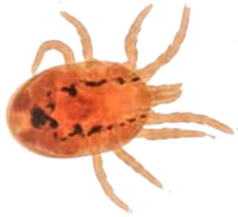
Die Rote Vogelmilbe ( Dermanyssus gallinae ) ist ein blut-saugender Ektoparasit an den verschiedensten Vogelarten. Der Mensch ist ein Fehlwirt, bei ihm kann die Milbe die Vogelhalter-Krätze auslösen.

Rund 50 Teilnehmer besuchten die dies-jährige Tagung der Deutschen Gesellschaft für Medizinische Entomologie und Acarologie (DGMEA) in Dornbirn, darunter auch 8 Fachstudenten. Nach dem großen Abendvortrag zur Biologie der Milben am Donnerstag (12.9.) gab es am Freitag (13.9.) 16 weitere Vorträge zu medizinisch relevanten Organismen. Am Samstag (14.9.) wurden mikroskopische Bestimmungsübungen an Milben durchgeführt. In den Pausen und während der gesellschaftlichen Anlässe blieb ausreichend Zeit zum fachlichen Austausch unter Kollegen.