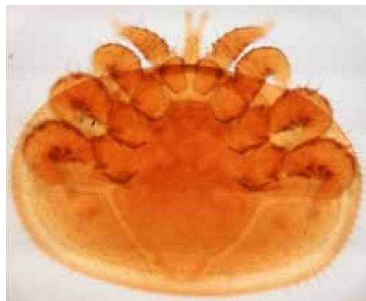
Die Varroamilbe ( Varroa destructor ) ist ein gefürchteter Schädling in Bienenstöcken.