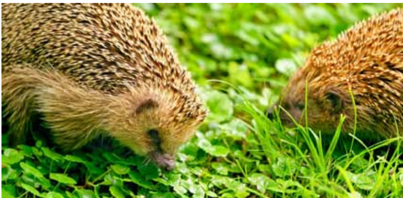
»Tiere im Winter« – unser Programm für die kleinen Gäste