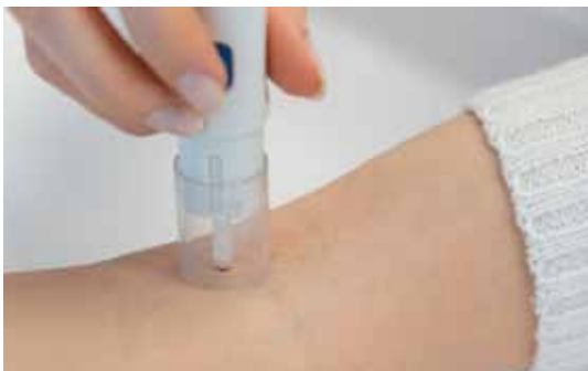
Nach dem Aufsetzen des Zeckendrehers auf der Haut stimuliert der feine rotierende Pinsel in der Mitte die Zecke schon nach wenigen Sekunden zum Loslassen.

Lyme-Borreliose ist eine bakterielle Infektion. Neben Zecken übertragen gelegentlich auch Bremsen diese Krankheit. Schutzimpfung gibt es keine, man kann sich nur durch vorbeugende Maßnahmen schützen. Im Frühstadium ist Borreliose gut mit Antibiotika zu therapieren. Doch sie bleibt oft unerkannt. Im Spätstadium ist eine Behandlung weit schwieriger. Ein rasches und sanftes Entfernen der Zecken kann, wie oben beschrieben, in den meisten Fällen vor Borreliose schützen!