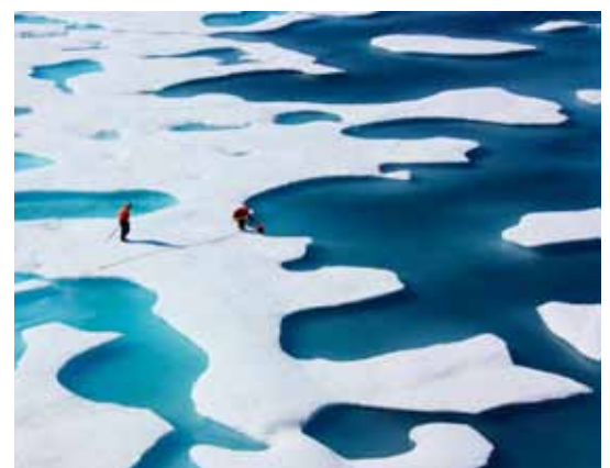
Mitte September 2020 ist das Meereis am Nordpol auf die zweitkleinste Sommerfläche seit Beginn der Satellitenmessungen im Jahr 1979 geschrumpft. Nur im Jahr 2012 gab es noch weniger Eis am Nordpol.