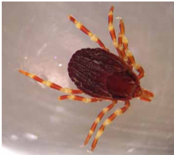
Eine der neu in Mitteleuropa eingeschleppten Megazecken, Hyalomma marginatum .