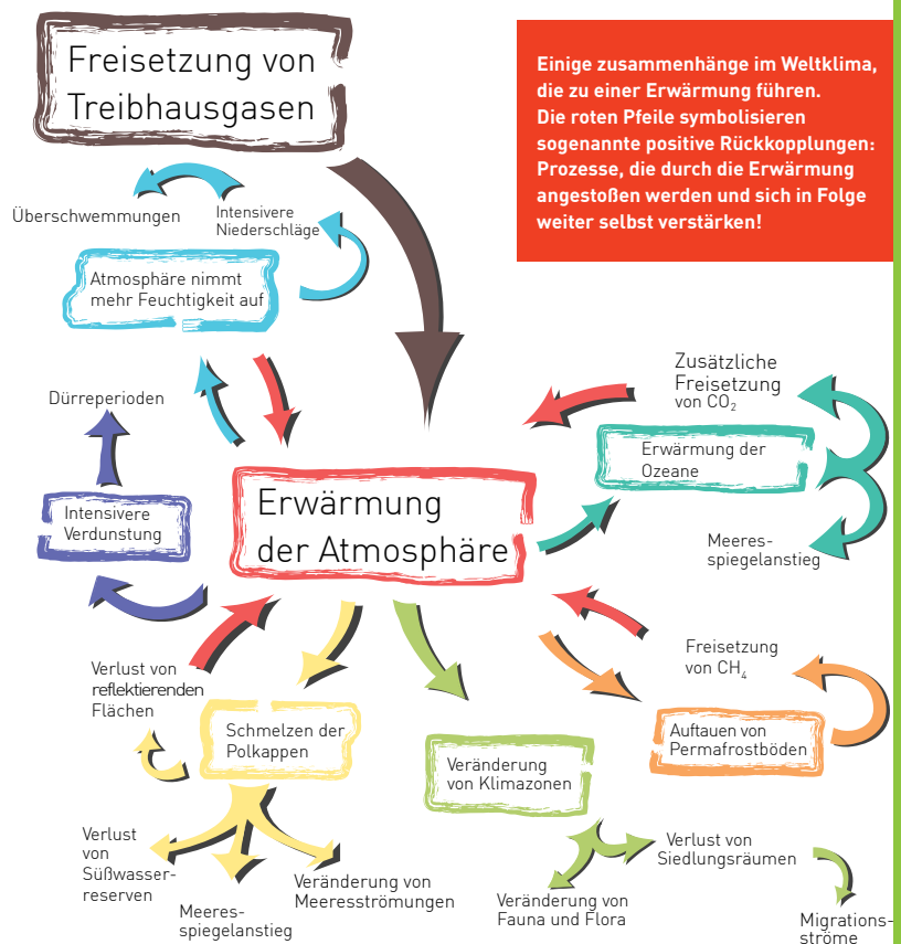
Folgen im Überblick aus der inatura Bildungsmappe Klima (www.klimaseite.at)