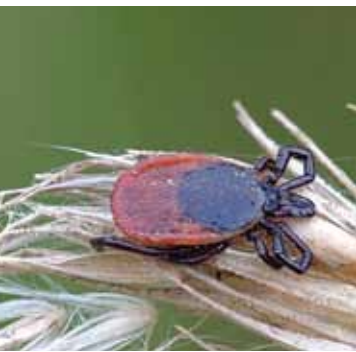
Gemeiner Holzbock (weiblich) auf trockenem Gras.

Der Gemeine Holzbock ( Ixodes ricinus ), die häufigste heimische Zeckenart, ist ein gefährlicher Krankheitsüberträger. Er kann Infektionen wie FSME (Frühsommer-Meningoenzephalitis) und Borreliose auf Menschen und Tiere übertragen. Andere Arten übertragen Q-Fieber, Babesiose, Hasenpest und weitere Krankheiten. Durch vorbeugenden Schutz lassen sich solche Infektionen in vielen Fällen vermeiden. Vorarlberg ist ein Zeckengebiet, die Anzahl der zeckeninduzierten Erkrankungen ist in den vergangenen Jahren angestiegen.