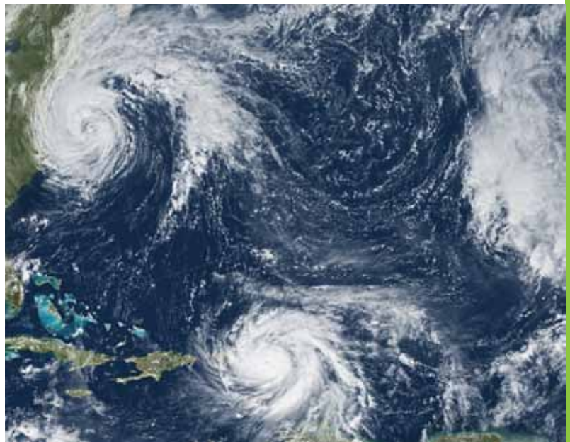
Die Hurrikan-Saison 2020 brachte dem Atlantik Rekorde, die wirklich niemand braucht. 30 Wirbelstürme – davon 7 als schwere Hurrikans eingestuft. Je wärmer die Ozeane werden umso größer wird das Potential für zerstörerische Wirbelstürme.