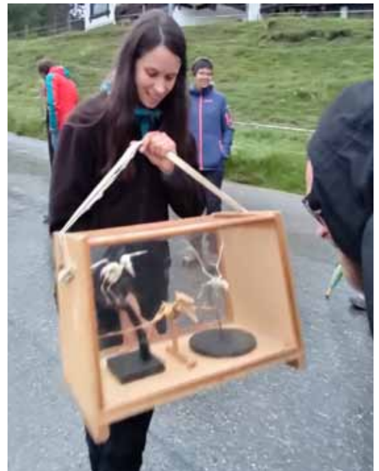
Illustrativer Schaukasten mit den Skeletten von Vogel und Fledermaus sowie einem gemeinsamen Vorfahren.