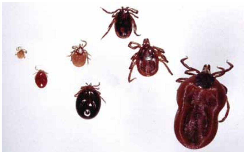
Lebenszyklus des Gemeinen Holzbocks, von links nach rechts: Larve vor und nach dem Saugen, Nymphe vor und nach dem Saugen, Adultes Männchen und Weibchen vor dem Saugen, teilweise vollgesogenes Weibchen.

Ein Zeckenweibchen kann mehr als 2.000 Eier ablegen. Die geschlüpften Larven sind sechsbeinig. Der ersten Häutung folgen ein oder mehrere Nymphenstadien. Vor jeder Häutung und vor der Eiablage ist eine Blutmahlzeit nötig. Lederzecken bleiben zeitlebens an einem Wirt bzw. in dessen Nest. Schildzecken wechseln ihre Wirte meist bei jedem Entwicklungsschritt. Zeckenlarven parasitieren an Mäusen, Nymphen und Adulte befallen größere Säuger und Menschen. Der Saugvorgang kann bei adulten Schildzecken mehrere Tage dauern.