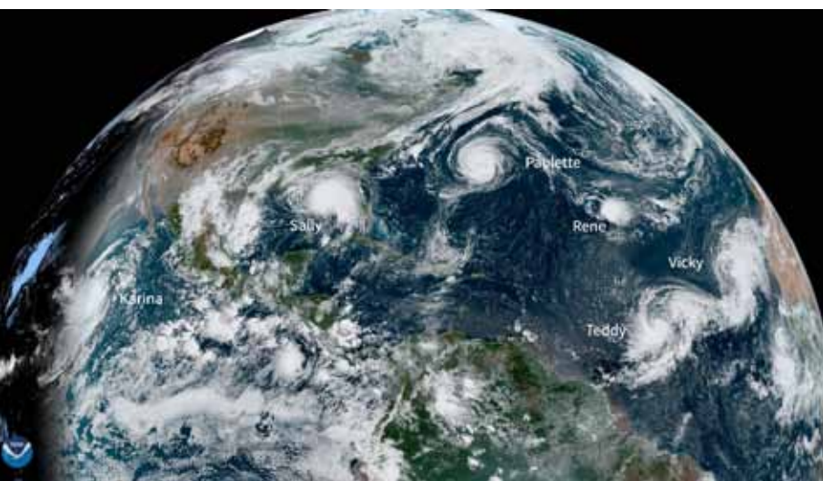
Ein Satellitenbild vom 14.09.2020: Noch nie zuvor waren 5 Wirbelstürme gleichzeitig über den Atlantik zu sehen. Über dem Pazifik entwickelte sich zeitgleich der tropische Sturm Karina und darüber zu sehen sind die Rauchwolken der kalifornischen Waldbrände.

Eine weitere bekannte Rückkopplung ist das Schmelzen der Polkappen, das durch die höheren Temperaturen ausgelöst wird. Schnee- und Eisflächen reflektieren bis zu 90% der einfallenden Sonnenstrahlung, ohne diese in Wärme umzuwandeln. Schmelzen diese weißen Flächen, so treten an ihre Stellen dunklere Flächen, die einen Großteil des einfallenden Lichts in Wärmestrahlung umwandeln. Vergleichen Sie dies vielleicht mit der unterschiedlichen Wärmeentwicklung eines weißen bzw. schwarzen T-Shirts, wenn man an der Sonne sitzt. Ozeane und Atmosphäre können sich weiter erwärmen, ohne dass zusätzliche Treibhausgase in der Atmosphäre benötigt werden. Die Eisschmelze setzt sich weiter fort. Das Schmelzen der Eisflächen setzt also selbst die Abwärts-spirale in Gang.