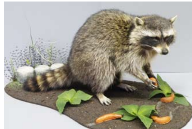
Waschbär Procyon lotor (Linnaeus, 1758) und Spanische Wegschnecken Arion vulgaris Moquin-Tandon, 1855 Der Waschbär, ein Neozoe aus Nord-Amerika, breitet sich in Europa aus. Nachweise aus Nordtirol sind dokumentiert.

Ausstellungstipps Zahlreich sind die Angebote an interessanten Ausstellungen in Museen und Ausstellungsräumen bzw. Ausstellungshäusern der unmittelbaren Umgebung. Wir haben für sie eine kleine Auswahl getroffen: