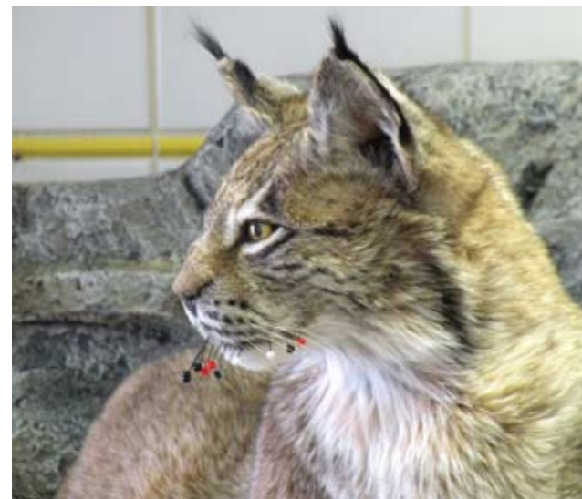
Der Nordluchs Lynx lynx (Linnaeus, 1758) wird in Tirol langsam wieder heimisch. Die Stecknadeln dienen während der Präparation der Fixierung der trocknenden Haut.