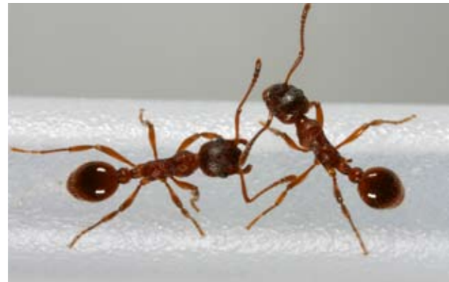
Myrmica rubra (Rote Wiesenameise)

Eine verblüffende Ausstellung über emsige Tierchen für Jung und Alt im Zeughaus