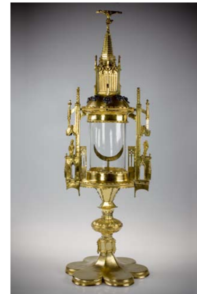
Monstranz, um 1500, Kupferlegierungen feuervergoldet; Email; TMLF Kunsthistorische Sammlung, Inv. Nr. Go/308, Fotos: TLMF