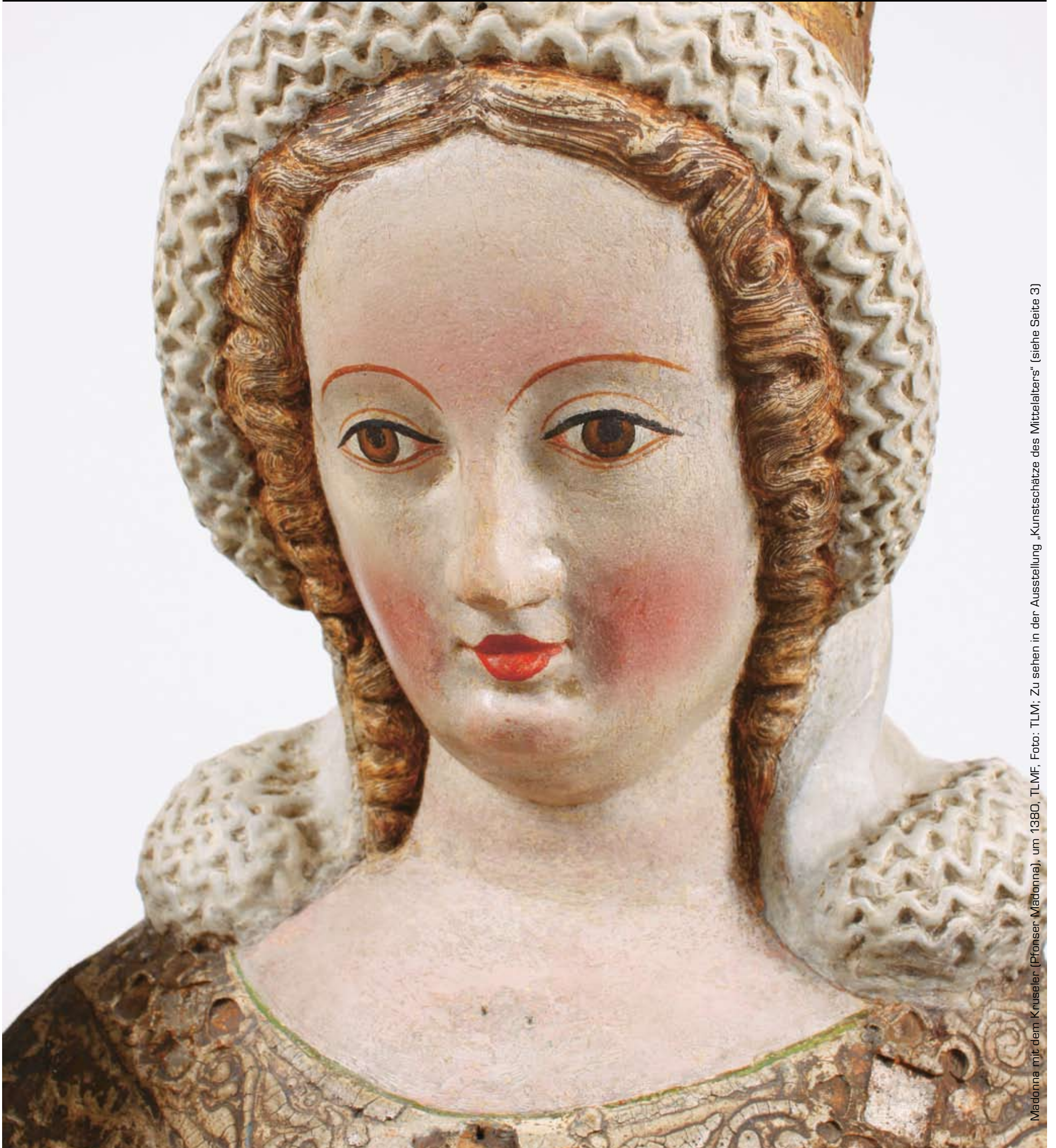
Madonna mit dem Kruseler (Pronser Madonna), um 1380, TLMF; Zu sehen in der Ausstellung „Kunstschätze des Mittelalters“ (siehe Seite 3)