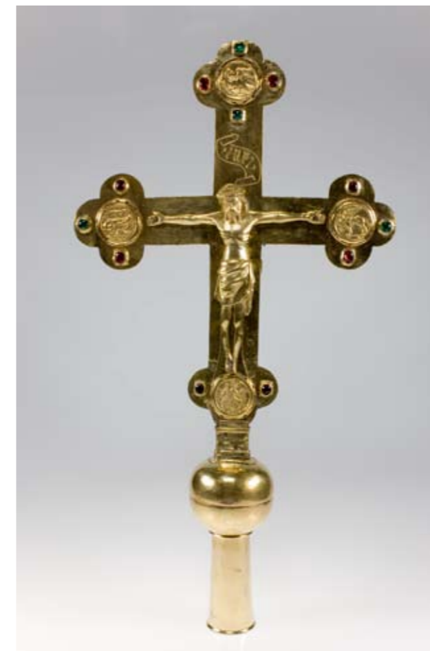
Vortagkreuz, 1. Hälfte 15. Jahrhundert, Kupferlegierungen feuervergoldet, farbige Glassteine; TMLF Kunsthistorische Sammlung, Inv. Nr. Go/7

Unter dem Mikroskop kann man an einer unpoliert gebliebenen Stelle eine Feuervergoldung anhand der Oberfläche erkennen. Als eindeutiger Nachweis dient die Röntgenfluoreszenzanalyse, mit der das gebundene Quecksilber (5–25%) in der Feuervergoldung nachgewiesen werden kann.