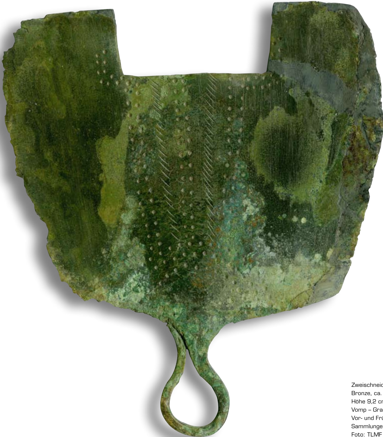
Zweischneidiges Rasiermesser vom Typ Croson di Bovolone, Bronze, ca. 11. Jh. v. Chr. Höhe 9,2 cm, Breite 8,1 cm Vomp – Grab 305 Vor- und Frühgeschichtliche und Provinzialrömische Sammlungen, Inv.Nr. U 19.230/305/12