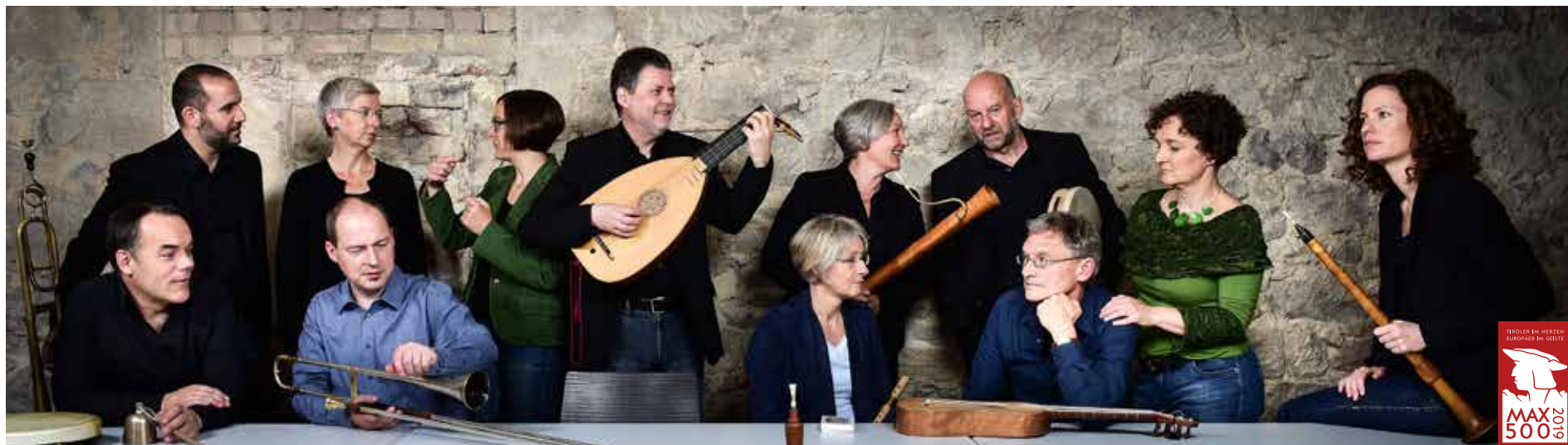
Abschlussprojekt mit dem Ensemble Capella de la Torre.

Das Kinder- und Jugendprojekt „Wir musizieren für Maximilian“ ist ein Beitrag zum Maximilianjahr 2019. LehrerInnen und SchülerInnen des Tiroler Musikschulwerks tauchen unter Anleitung von international renommierten SpezialistInnen in die Welt der Renaissancemusik ein. Dieses Konzert ist Höhepunkt und Abschluss des Projektes: Profis musizieren mit den Workshop-