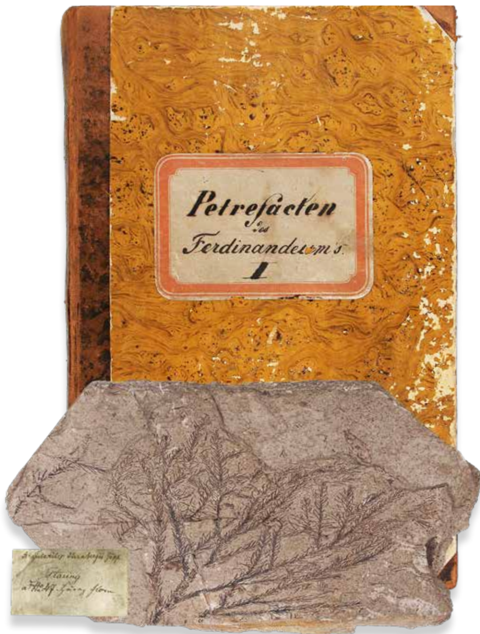
Inventarbuch 1 der Petrefakten-Sammlung. Im Vordergrund eine Gesteinsplatte mit Araucaria sternbergi mit Originaletikett aus der oligozänen „Häringer Flora“ bei Bad Häring, Unterinntal.

Die Petrefakten-Sammlung enthält neben einigen schönen Schaustücken auch wertvolle Typusbelege und Abbildungsoriginale. Darunter befinden sich wissenschaftliche Beschreibungen neuer Arten (Holotypen), beispielsweise von fossilen Fischen aus den bitumenreichen Gesteinen der Seefeld Formation oder von Schnecken (Gastropoda) und Muscheln (Bivalvia) aus den tertiären „Häringer Schichten“ nahe Kufstein. Der Großteil der Fossilien ist mit alten, vorgedruckten Etiketten versehen. Auf ihnen wurden handschriftlich Inventarnummer, Name des Objekts, Fundort und die Region vermerkt. Bei einem Teil der Fossilien sind Inventarnummer, Name und Fundort direkt am Fossil mittels Lackschicht angebracht worden. Zur Sammlung existiert ein gebundenes Inventar in Buchform. Dieses umfasst drei Einzelbände, wobei die Einträge nach Regionen geordnet wurden. Die Fossilien-Sammlung enthält Funde aus Vorarlberg und aus Tirol in seinen alten Grenzen. Somit erstreckte sich das Sammelgebiet neben Nord- und Ost- auch auf Südtirol und die Provinz Trient. Mit der Eingliederung der Petrefakten-Sammlung in die vorhandenen Bestände wurde im Herbst begonnen. Im Zuge dieser Arbeiten wird die gesamte paläontologische Sammlung digitalisiert. Damit soll künftig die erdwissenschaftliche Sammlung für wissenschaftliche Untersuchungen und für Interessierte leichter zugänglich sein.