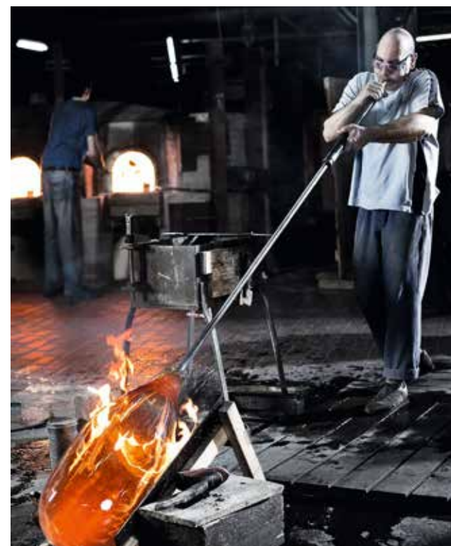
Abb. li. und Mitte: Vasenpokal mit Diamantriss, 1570–1590, Haller Glashütte oder Hofglashütte Innsbruck, 37,5 x 22,1 cm, Kunstpalast, Düsseldorf, Glasmuseum Hentrich. Abb. re.: Der Glasmacher bläst einen Echt-Antik-Glas Zylinder, der geöffnet und zu Flachglas gestreckt wird.

Zu Beginn der Renaissance sollte der erworbene Wohlstand gezeigt werden. Die Häuser der Adligen und später auch der begüterten Bürger erhielten großflächigere Fenstergläser (Sechseck und Rauten als Bleiverglasung, bemalte Gläser usw.), wobei das Flachglas damals vorwiegend aus Murano kam. Das heimische Waldglas entsprach durch die minderwertigere Glasqualität (extreme Grün- oder Braunfärbung, welligere Oberfläche und kleine Maße) nicht mehr dem Trend der Zeit. Glas aus muranesischen Hütten glich hingegen in seiner Reinheit und Durchsichtigkeit dem Bergkristall, es wurde daher „cristallo“ genannt. Dieses wurde in großem Stil exportiert und füllte durch Steuern und Mauteinnahmen die Kassen Venedigs.