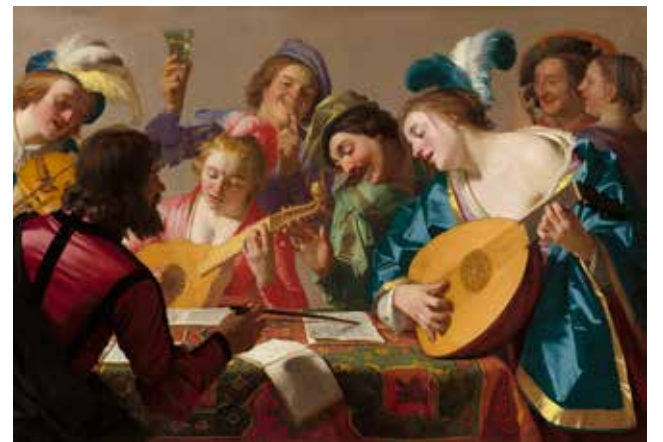
Gerard van Honthorst, Das Konzert, 1623, Öl auf Leinwand, 123 x 206 cm