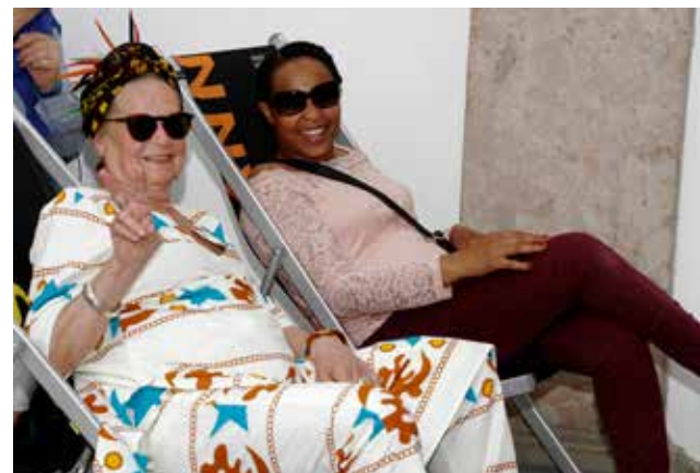
Fest der Vielfalt 2017.

alles Tirol“, die den Kulturaustausch thematisierte. Das Fest bot auch Gelegenheit zu einem Sammelauftritt von Objekten der Arbeitsmigration für die im Folgejahr geplante Ausstellung „Hier zuhause. Migrationsgeschichten aus Tirol“. Seitdem sind Erzählcafés, mehrsprachige Lesungen und interkulturelle Gespräche fixer Bestandteil des Festes. Weitere Partner aus Bildung, Kultur und Migrationsvereinen sind hinzugekommen und das nicht zuletzt durch die erfolgreiche Veranstaltungsreihe FORUM MIGRATION 2018 im Ferdinandeum. Das 350-jährige Jubiläum der Universität Innsbruck ist Anlass für die Ausstellung „Multiversität. Internationale Studierende in Innsbruck 1955 bis 1995“, die dieses Jahr beim Fest der Vielfalt im Volkskunstmuseum zu sehen sein wird.