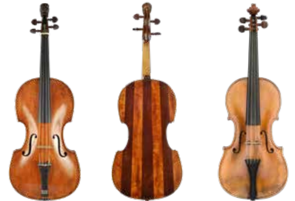
Meisterwerke der Geigenbaukunst von Jakob Stainer.

Der 400. Geburtstag Stainers ist Anlass für eine erste gemeinsame Tagung aller drei deutschsprachigen Geigenbauverbände (Deutschland, Österreich, Schweiz). Im Ferdinandeum sind ausgewählte Stainer-Instrumente zu sehen. Das Rahmenprogramm bietet Gelegenheit, Musik aus der Zeit Stainers und seine Instrumente zu hören. Details zum Programm finden Sie im eigenen Folder bzw. auf www.tiroler-landesmuseen.at .