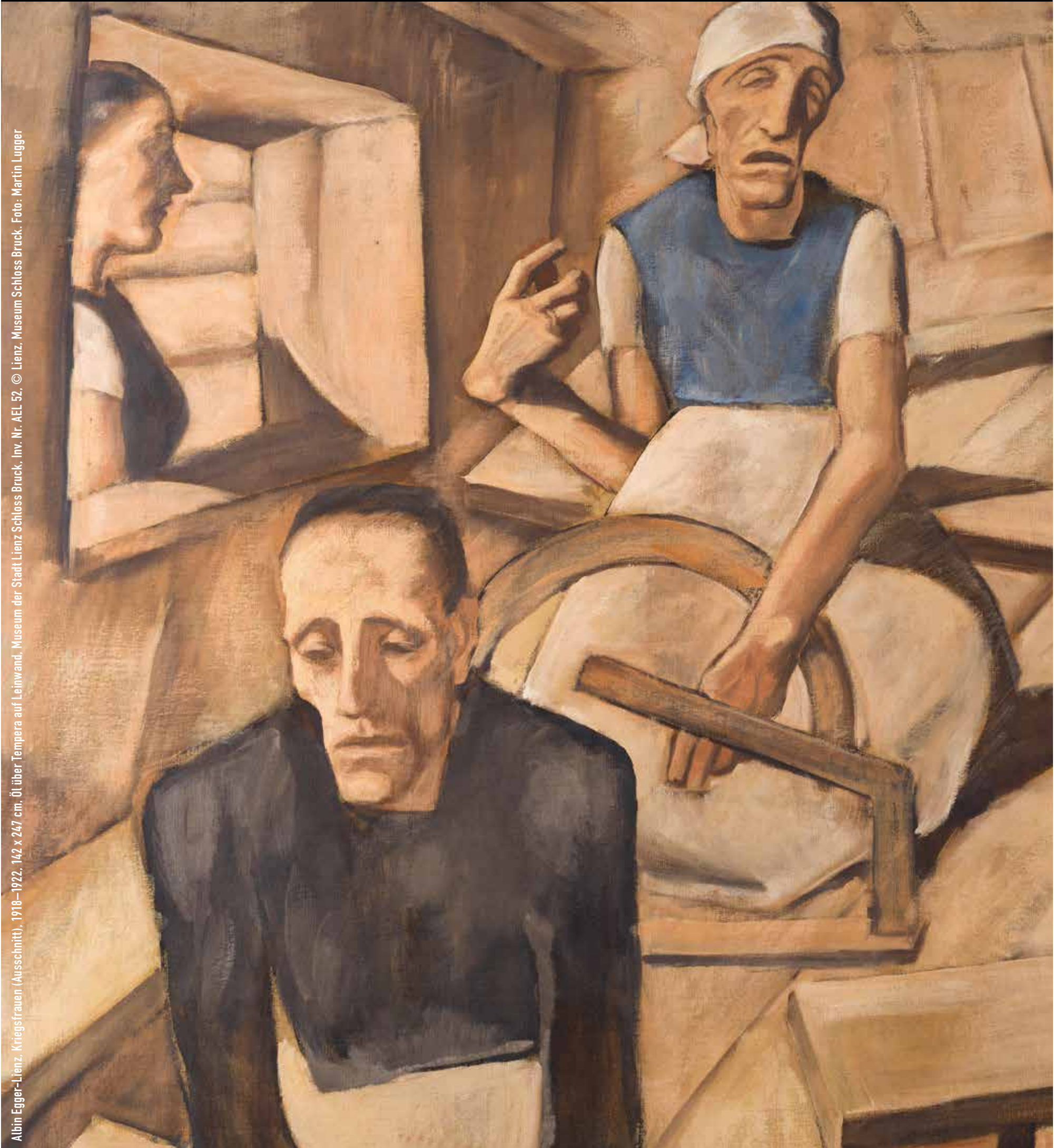
Albin Egger-Lienz, Kriegsfrauen (Ausschnitt), 1918–1922, 142 x 247 cm, Öl über Tempera auf Leinwand, Museum der Stadt Lienz Schloss Bruck, Inv. Nr. AEL 52, © Lienz, Museum Schloss Bruck, Foto: Martin Luggner