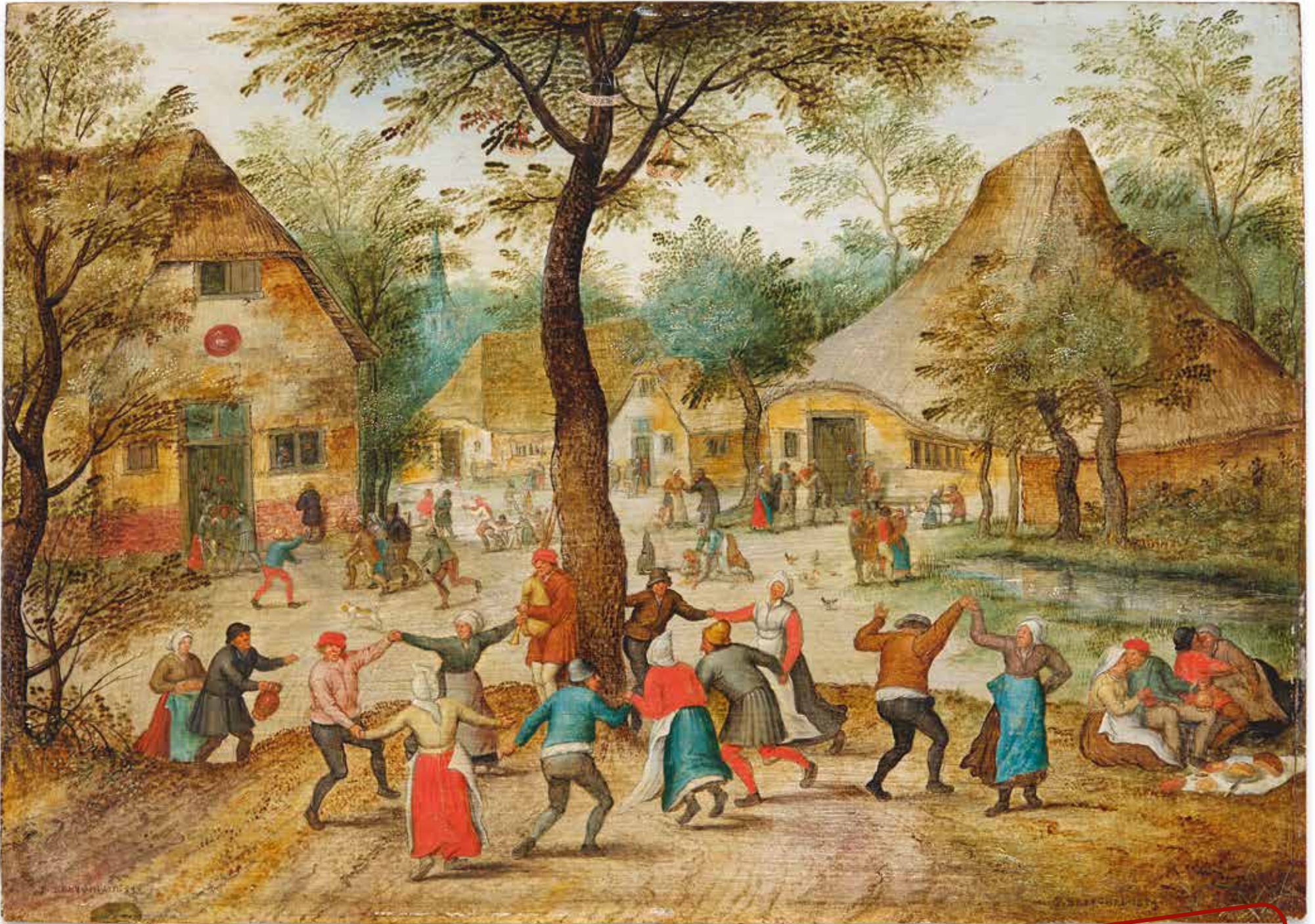
Pieter Brueghel d. J., Bauerntanz um den Maibaum, 1634, Öl auf Holz.