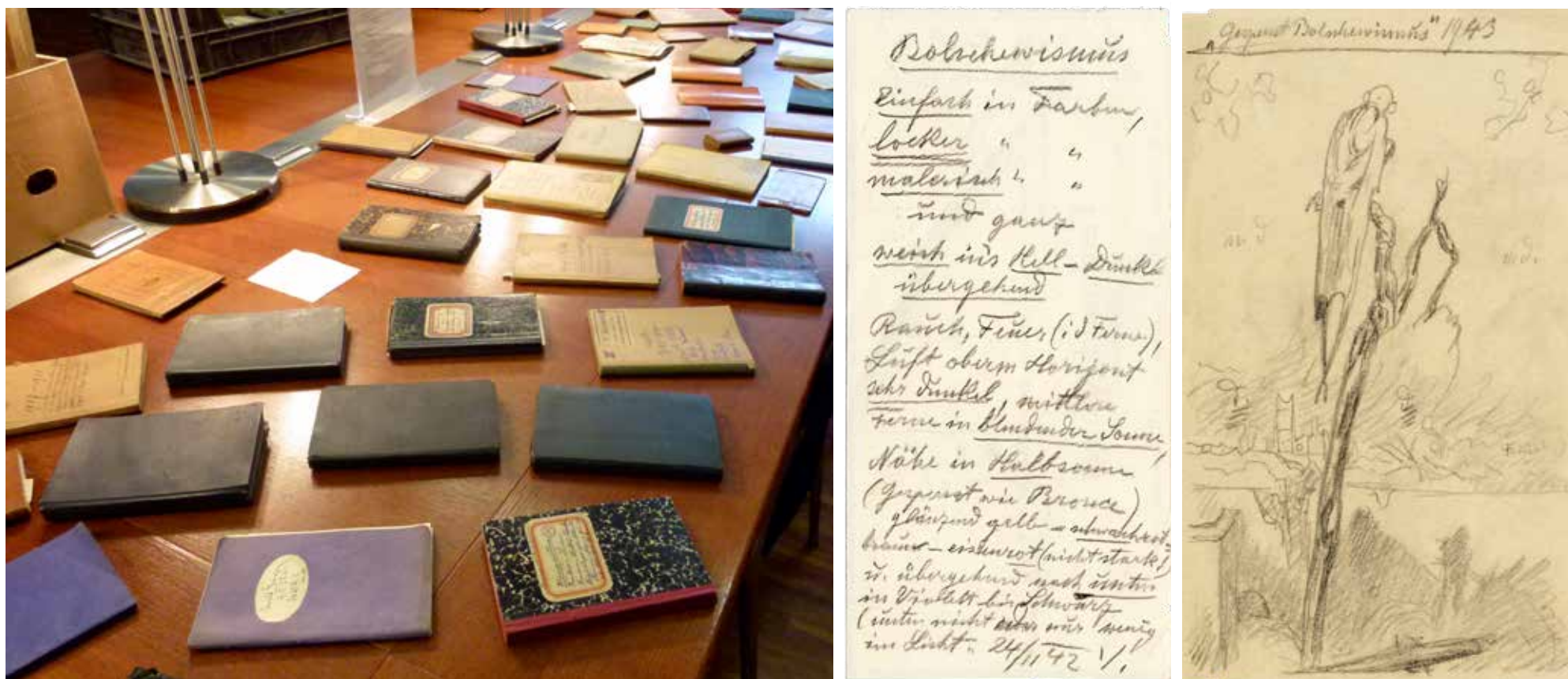
Abb. li.: Bei der Sortierung und Sichtung der Skizzenhefte, Tage- und Notizbücher aus dem Teilnachlass Hugo Grimm, TLMF Bibliothek. Abb. Mitte und re.: Notizen und Skizze Hugo Grimms zu seinem Werk „Das große Elend“, das Grimm über 20 Jahre lang bearbeitete und in mehreren Varianten zeichnete und malte, TLMF Bibliothek/Nachlasssammlung

Für die wissenschaftliche Auseinandersetzung mit dem Leben einer Person ist das Heranziehen des persönlichen Nachlasses von zentraler Bedeutung. Die in der Bibliothek beheimatete Nachlasssammlung der Tiroler Landesmuseen stellt die Benutzbarkeit und Zugänglichkeit dieser Quellen für die wissenschaftliche Forschung sicher. Der Teilnachlass des Tiroler Malers Hugo Grimm ist ein „Neuzugang“.