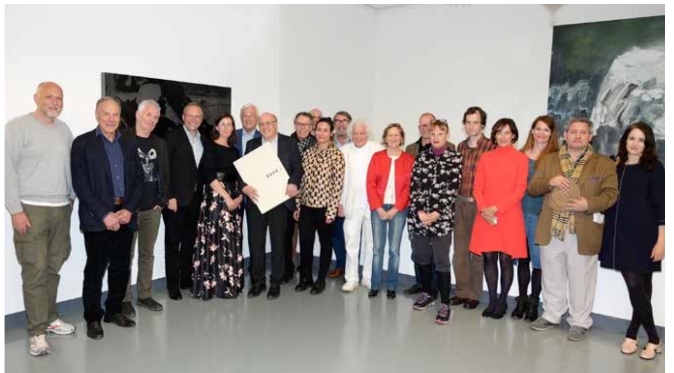
An der Edition „dank I“ für Günther Dankl beteiligten sich 30 KünstlerInnen.