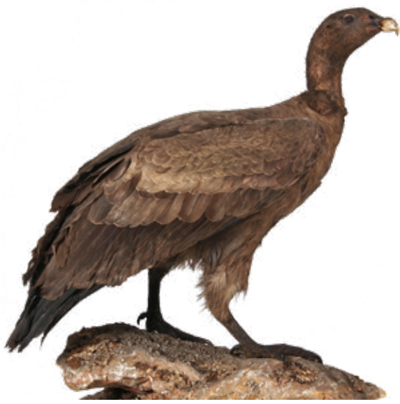
Dermoplastik eines juvenilen weiblichen Andenkondors, TLMF, Naturwissenschaftliche Sammlungen, Ornithologie.

Wie kam nun dieser südamerikanische Geier in die Sammlung der Tiroler Landesmuseen? Als Irrgäste verfliegen sich wohl immer wieder Vögel von Amerika nach Europa, meist Seevögel wie Möwen, aber auch Singvögel als blinde Passa-