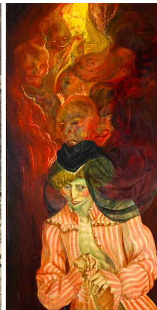
Abb. li.: Otto Dix, Sterbender Soldat aus dem Radierwerk „Der Krieg“ (Mappe 3), 1924, 47,7 x 35,3 cm, Radierung, Ätzung, Aquatinta, Kaltnadel. © Zeppelin Museum Friedrichshafen, Leihgabe Land Baden-Württemberg. © Bildrecht Wien, 2019. Abb. re.: Otto Dix, Die Irrsinnige, 1925, 120,40 x 61,50 cm, Tempera (Mischtechnik) auf Holz. © Foto: Kunsthalle Mannheim. © Bildrecht Wien, 2019

Die Vergänglichkeit trifft auf die Erbsünde und gibt dabei den Blick auf allzu menschliche Abgründe frei. Die Witwen von Egger-Lienz sind die „Kriegsfrauen“ (Titelblatt). Wie die sogenannten Klageweiber der Antike erstarren sie in gequälten Mienen, die von konventionellen Klagegesten begleitet werden. Egger-Lienz verwandelt jedoch den Schmerz in Schicksalshingabe, indem er seine Witwen wie die mythologischen Schicksalsgöttinnen die Lebensfäden halten lässt. In „Mütter“ erweitert er seine Zeitdiagnose um die Hoffnungslosigkeit, der Witwen mit von Armut und Leid gezeichneten Kindern innewohnt. Die Gegenwart des Gekreuzigten neben den anderen Figuren im Gemälde unterstreicht das alltägliche Martyrium und die Allgegenwart des Todes.