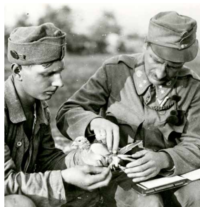
Zwei österreichische Soldaten der Südwest- bzw. Isonzofront befestigen eine Depesche an einer Brieftaube, 1917.

letzte Taubenstation der Gendarmerie wurde 1974 aufgelassen, da sie aufgrund des Ausbaus des Funknetzes nicht mehr gebraucht wurde. Das österreichische Bundesheer hatte in Wien noch bis Mitte der 1980er-Jahre Brieftauben in Verwendung.