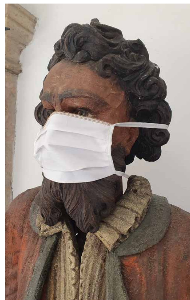
Der Torwächter im Volkskunstmuseum wurde kurzerhand auch mit Nase-Mund-Schutz ausgestattet und gepostet.

Inhalte in dieser Dichte und Qualität zu produzieren, ist viel Aufwand und war nur möglich, weil andere Aufgaben innerhalb der Abteilung „Marketing und Kommunikation“ in dieser Ausnahmesituation nicht durchführbar waren oder aufgrund abgesagter bzw. verschobener Termine Ressourcen frei wurden. Im Nach-Corona-Normalbetrieb lässt sich dies, ohne mindestens zwei neue Mitarbeiter*innen, freilich nicht in dieser Dimension aufrecht erhalten. Die Ressourcen in der Krisenzeit wurden sehr effizient genutzt, um zusätzlich zu von zu Hause aus durchführbaren Arbeiten weitere Online-