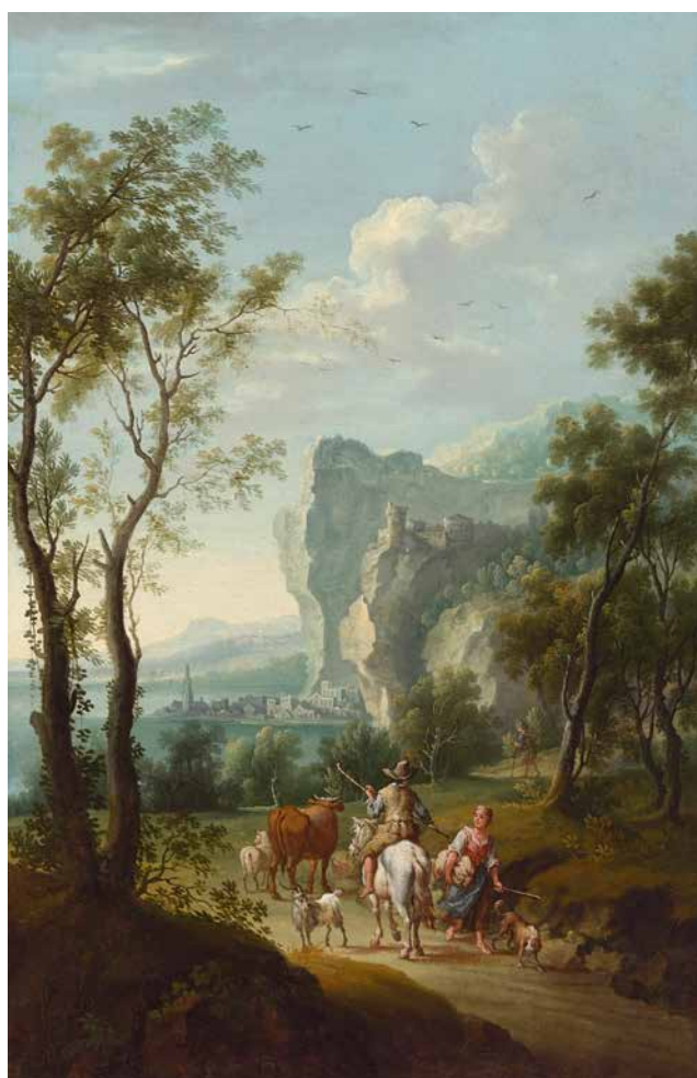
Knoller Martin, Gruppenporträt Karl Graf von Firmian mit Gefolge bei einem Ausflug in die Umgebung von Neapel, 1758, Öl auf Leinwand.

Diese prachtvollen Zuordnungen sind natürlich ein kulturelles Produkt, eine Konstruktion, die nur selten mit der Realität übereinstimmt. Aber dieses kulturelle Konstrukt ist über viele Jahrhunderte aufgebaut worden und erweist sich bis heute als erfolgreich. Zentraler Protagonist dieser „Bildaufbauarbeit“ ist niemand geringerer als der noch immer wichtigste deutsche Dichter Johann Wolfgang (von) Goethe. Mit seiner „italienischen Reise“, die sich auf einen Italienaufenthalt zwischen 1786 und 1788 bezieht, hat er einen literarischen Text gestaltet, der dieses Sehnsuchtsland Italien auf intensive Weise als persönliches künstlerisches Erlebnis beschreibt. Das „Land, in dem die Zitronen blühen“ ist ihm ein künstlerisches Entwicklungsparadies, wie auch ein persönlicher Lernort. Auch wenn in seinen Beschreibungen immer wieder Kritik an den realen Verhältnissen auftaucht – das betrifft z. B. die Politik, die Sauberkeit, die fehlende Organisation – so hält er doch mit großer Konsequenz an seinem Idealbild fest. „Et in arcadia ego“ – auch ich bin in Arkadien.