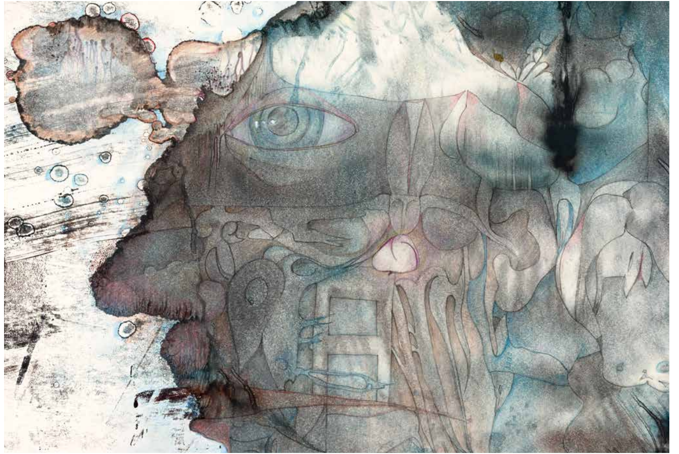
Birgit Jürgenssen, Gesicht, 1969, Bleistift, Aquarell und Pinsel in Schwarz (Tusche) auf Papier, 259 x 424 mm.

vor Augen. Vielmehr dokumentiert die Zeichnung als ein Kunstwerk eigenen Rechts den suchenden Weg zur Lösung eines künstlerischen Problems, der einen mitunter außerordentlich idiomatischen Verlauf nimmt, ehe er im Gemälde oder der Skulptur zur „markttauglichen“ Ausführung gelangt. So aufregend es sein kann, diese von Kunstschaffenden eingeschlagenen Wege mit den Augen nachzuschreiten – die Zeichnung gewährt uns einen Blick gewissermaßen in die Herzkammer des Kunstgeschehens –, so sehr fordert dieser sinnliche Genuss den Betrachtenden bei der Begegnung mit der originalen Zeichnung viel Aufmerksamkeit und Geduld ab. Belohnt wird diese Anstrengung mit einem befreiten Blick wiederum auf die ausgeführten Werke, deren ästhetische Qualität mit dem Wissen über ihren Entstehungsweg noch um ein Vielfaches gesteigert wird. „Nichts ist dem strebsamen Bilderkenner wärmer zu empfehlen und ans Herz zu legen als eifriges Studium der Zeichnungen. Wer sich von den Gemälden eines Meisters zu den Zeichnungen wendet, dem scheint sich ein Vorhang zu heben, und er dringt in das innere Heiligtum“ (Friedländer, Von Kunst und Kennerschaft, 1955). Die museale, konservatorisch wie kunstwissenschaftlich gebotene Trennung der