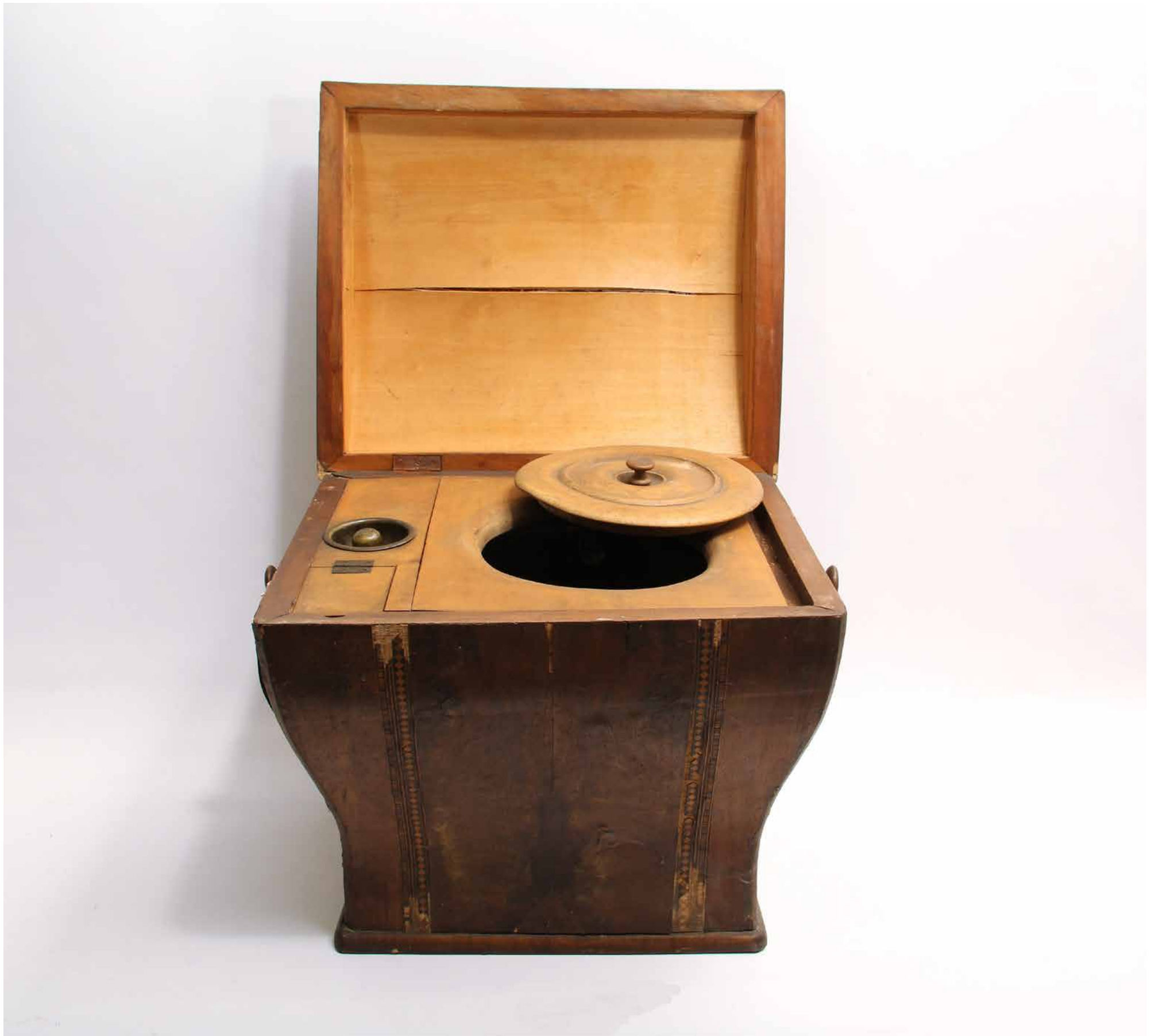
Zimmertoilette mit integrierter Spülung, 1. H. 19. Jh., Historische Sammlungen, Inv.-Nr. AK/MOE/41.