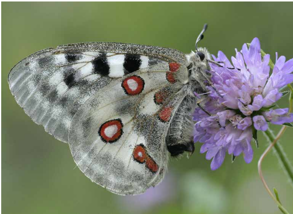
Der international streng geschützte Apollofalter kommt im Farst auffallend häufig vor.

Die steilen Sonnenhänge unterhalb des Weilers Farst in Umhausen sind ein Eldorado für Schmetterlinge. In wenigen Jahren konnten hier 866 Arten beobachtet werden, eine überregional wertvolle Vielfalt, die es für künftige Generationen zu bewahren gilt.