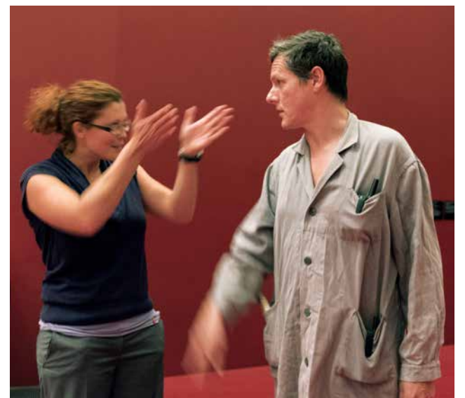
Lachen im Museum bei kabarettistischen Führungen.

Bitte überprüfen Sie die Termine auf tiroler-landesmuseen.at