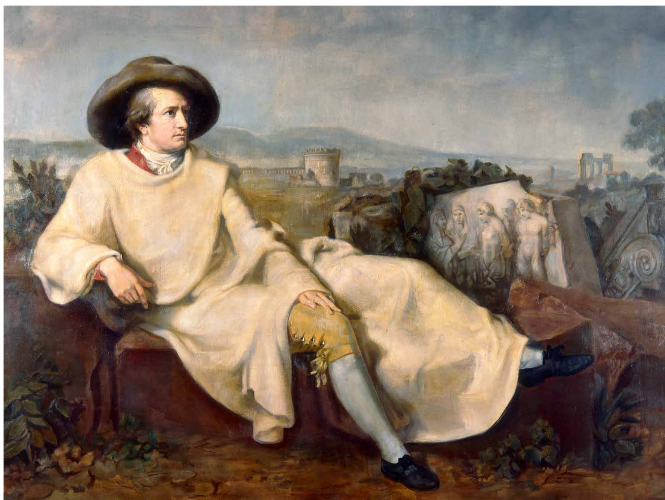
Reinhold Ewald, Goethe, Johann Wolfgang von (1749–1832) in der Campagna, 1959, ölhaltige Farben auf Leinwand (nicht analysiert), 167 x 211 cm, Klassik Stiftung Weimar, Museen, Inv.-Nr. KGe/00556.

Kaum ein anderes Land der Welt ist so mit vielen schönen Bildern aufgeladen wie Italien. Es hat sich in steigender Entwicklung in der jüngeren Vergangenheit zu einem zentralen Tourismusland entwickelt, Menschen aus aller Welt suchen hier ein Paradies des guten Lebens. Gutes zum Anschauen, Gutes zum Essen, Gutes zum Anziehen, gutes Wetter, etc. Insbesondere gilt dies für jene Menschen in Europa, die nördlich der Alpen wohnen, Italien ist das Sehnsuchtsland für „dolce vita“ schlechthin.