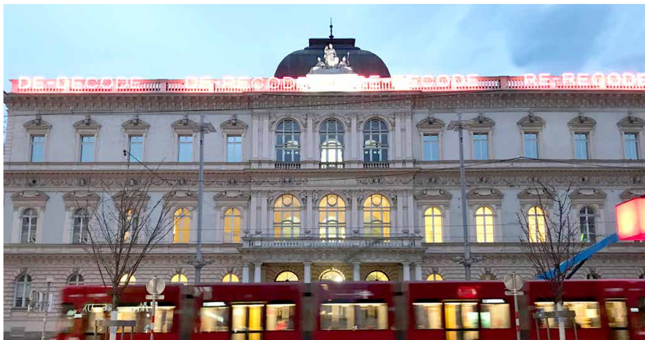
Kunst im öffentlichen Raum als demokratischer Denkraum.

In den vier möglichen Varianten de-decode, de-recode, re-decode und re-recode entsteht ein variabler Denkraum, ein Ideenumriss, der sowohl eine Aufforderung ist, mit seinem Intellekt in ein libidinöses Verhältnis zu treten, als auch den Umbau des Ferdinandeums ankündigt und symbolisch vorwegnimmt. Es gehört zu den demokratischen Eigenschaften von Kunst im öffentlichen Raum, dass sie dem gehört, der sie betrachtet.