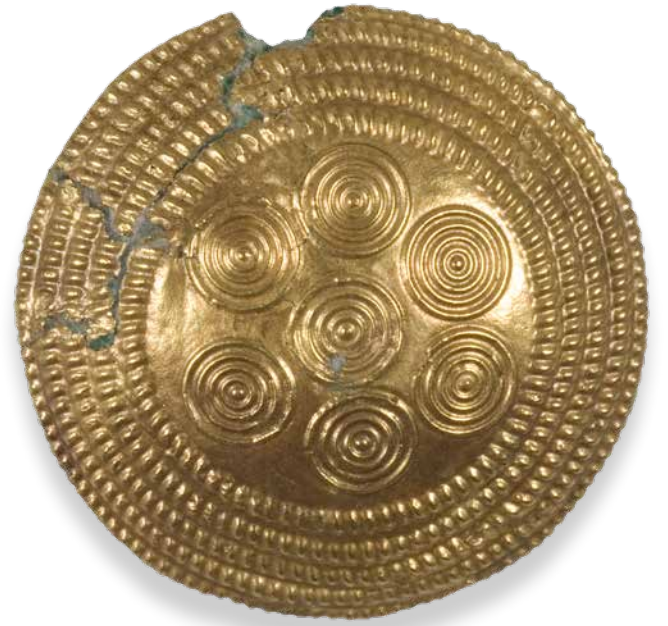
Bronzezierknopf mit Goldfolieüberzug, 13./12. Jh. v. Chr., Innsbruck-Mühlau, Grab 1, Dm 2,8 cm, Vor- und Frühgeschichtliche und Provinzialrömische Sammlungen, Inv.-Nr. U 10.400.

Insbesondere die Reste feinen Golddrahtes vermutlich von der Kleidung und fünf Bronzezierknöpfe erschließen den hohen sozialen Status der Bestatteten. Nur auf einem Knopf erhielt sich nahezu unversehrt die Goldfolie mit zentralem Sonnenmotiv aus vier konzentrischen Kreisen um einen kleinen Buckel und rundum sechs symmetrisch angeordneten gleich gestalteten Punzen. Diese sind von fünf Kreisen aus leicht schräg ausgerichteten kleinen Rechteckpunzen eingefasst. Die durch die Anordnung der Rechteckpunzen angedeutete Dynamik vermittelt die Strahlen der Sonne, die Vielzahl der Punzenkreise deren intensive Strahlkraft.