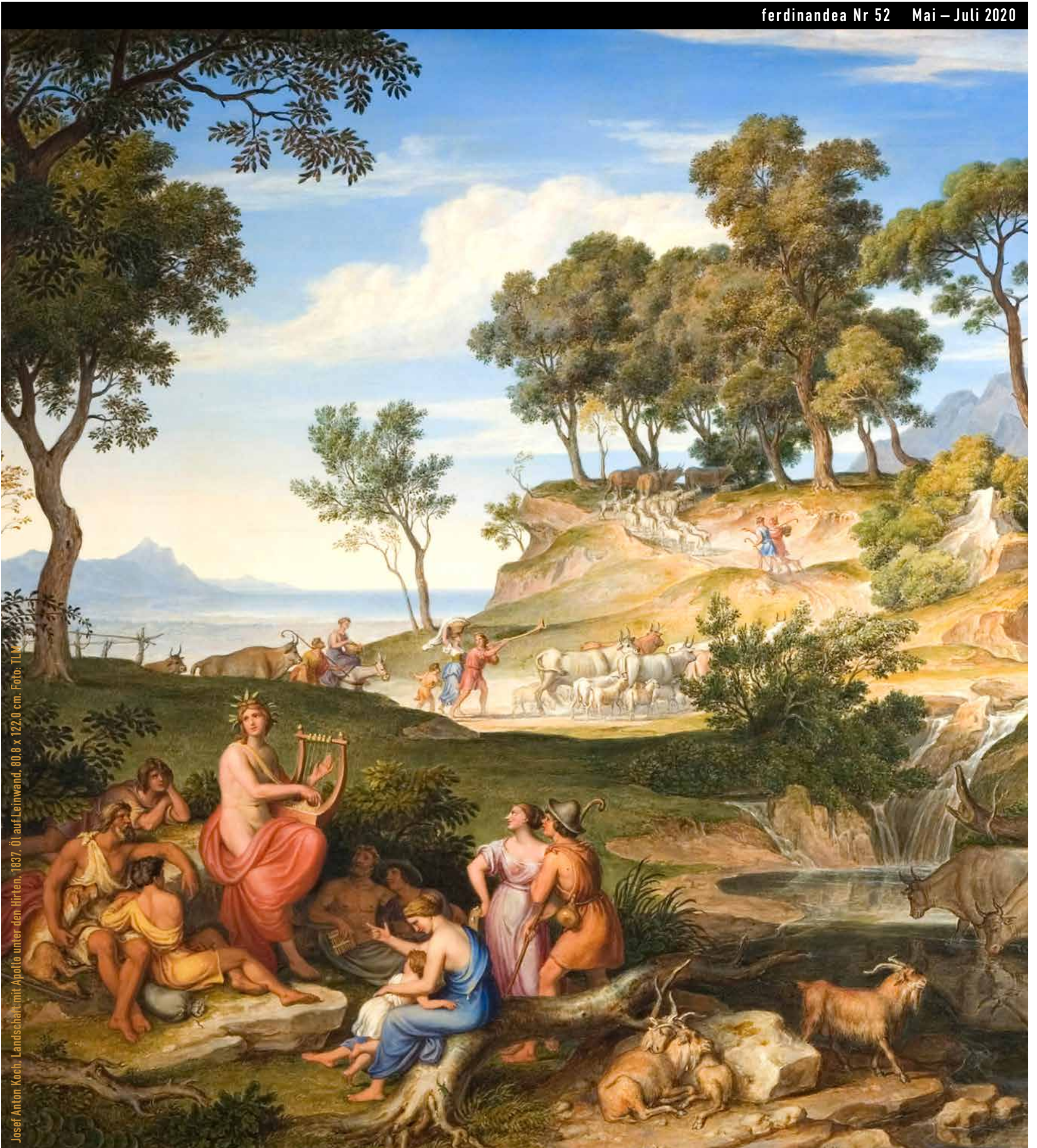
Josef Anton Koch, Landschaft mit Apollo unter den Hirten, 1837, Öl auf Leinwand, 80,8 x 122,0 cm.