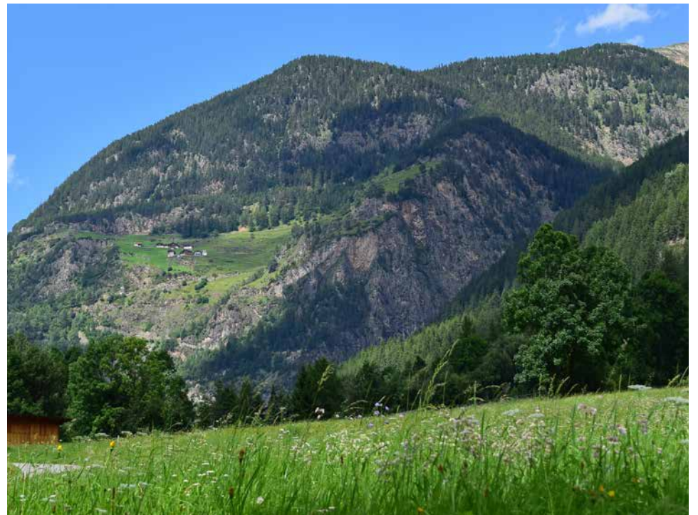
Umhausen-Farst (Bildmitte), der „Adlerhorst des Ötztals“.