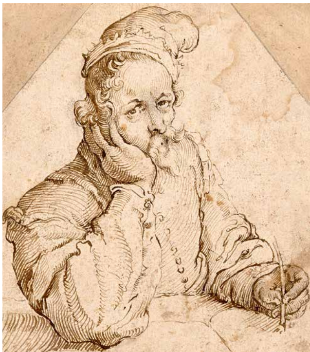
Abb. links: Jakob Matham, Bildnis eines Zeichners, Feder in Graubraun auf Papier, 127 x 108 mm. Abb. rechts: Girolamo Francesco Maria Mazzola, gen. Parmigianino (zugeschr.), Raub der Persephone, Feder in Braun, graubraun laviert, auf Papier, 191 x 238 mm.

Die Trennung der grafischen Werke von den sonstigen kunsthistorischen Beständen unterläuft vordergründig den ursprünglichen, werkprozessualen Funktionszusammenhang von Zeichnung und ausgeführtem Gemälde oder Bildwerk, gehorcht aber der seit Jahrhunderten üblichen musealen Einteilung einer Kunstsammlung nach Gattungen. Dies dient nicht nur den besonderen konservatorischen Anforderungen, die Arbeiten auf Papier an uns stellen: Sie sind außerordentlich lichtempfindlich und bedürfen in noch viel stärkerem Maße als Gemälde oder Skulpturen einer sorgfältigen Bewahrung und besonderen Ausstellungsweise. Auch ist der ästhetische Zugang zur Zeichnung bisweilen mühsam. Anders als mit den Exemplaren der Malerei, Bildhauerei oder auch der Druckgrafik steht uns in der Zeichnung nicht ein abgeschlossenes, autonomes Werk