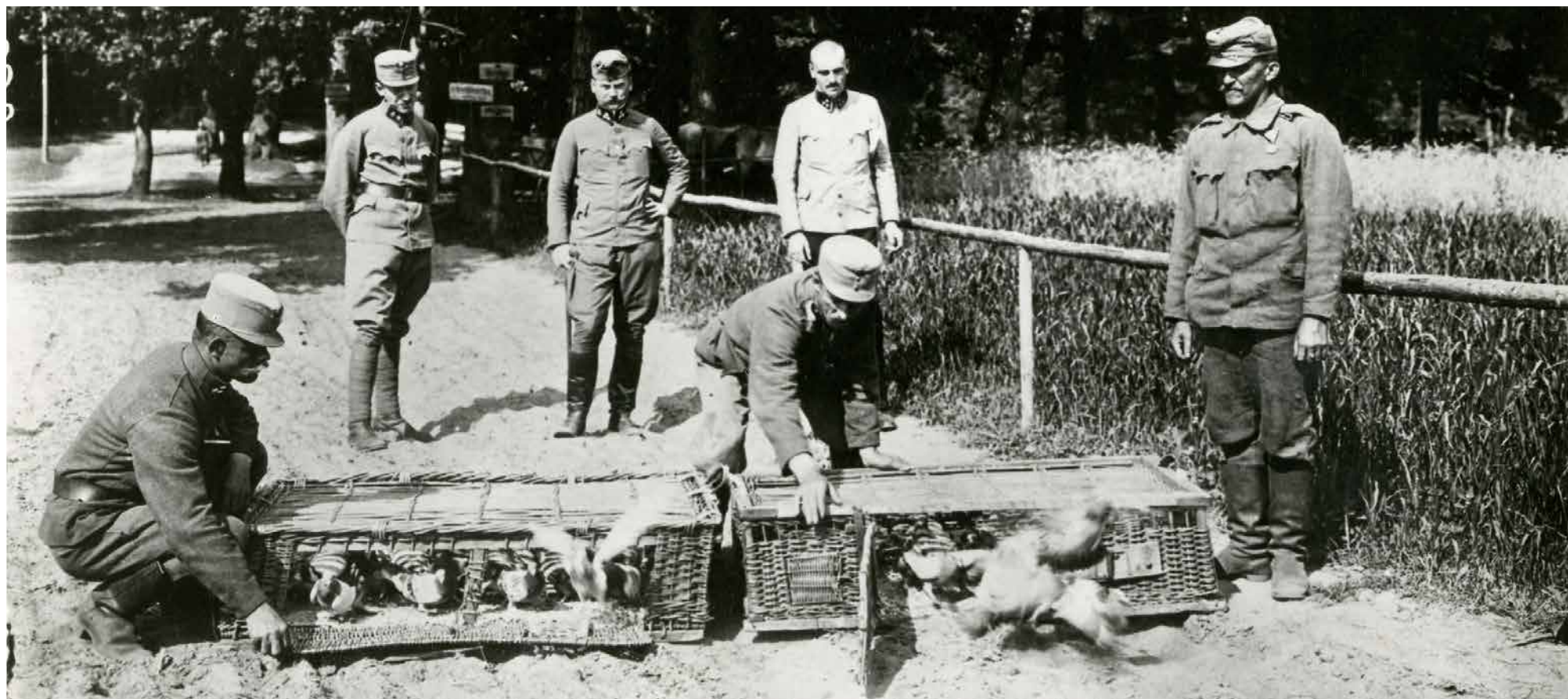
Brieftaubenabflug in Galizien, 1. Juli 1918.

Beim Stichwort „Telekommunikation“ denken wir heute in erster Linie an elektrotechnische Entwicklungen, die es uns ermöglichen, zeitgleich mit der ganzen Welt verbunden zu sein. Es gab jedoch schon vor dieser Technisierung ab der Mitte des 19. Jahrhunderts Möglichkeiten, sich über große Strecken hinweg zu verständigen, die später vor allem im militärischen Bereich wieder aufgegriffen wurden.