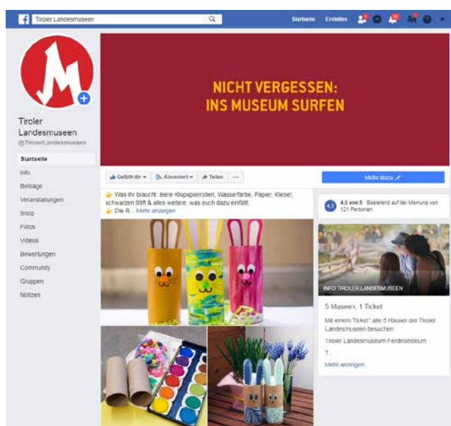
Screenshot der Facebook-Page der Tiroler Landesmuseen