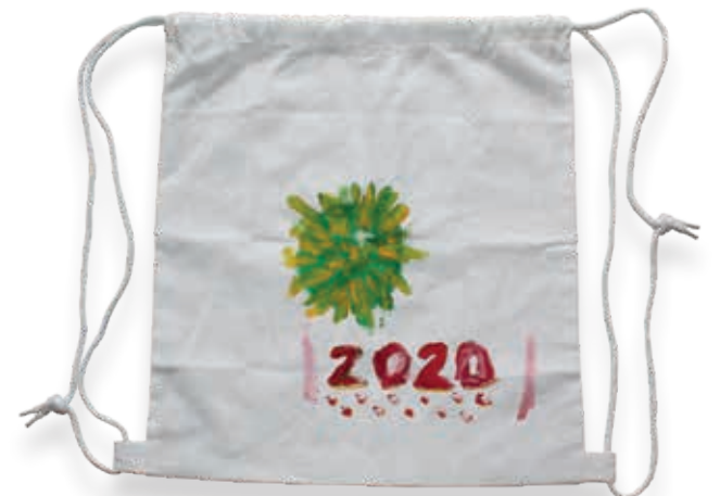
Kinderzeichnung des Corona-Virus auf einem Stoffrucksack, entstanden im Zusammenhang mit einem Aufruf von Life Radio Tirol.

Im heurigen Wissenschaftlichen Jahrbuch wird ein Aufsatz Einblicke in einen wesentlichen Teil der Museumsarbeit hinter den Kulissen – im Zusammenhang mit der „Corona-Krise“ – bieten.