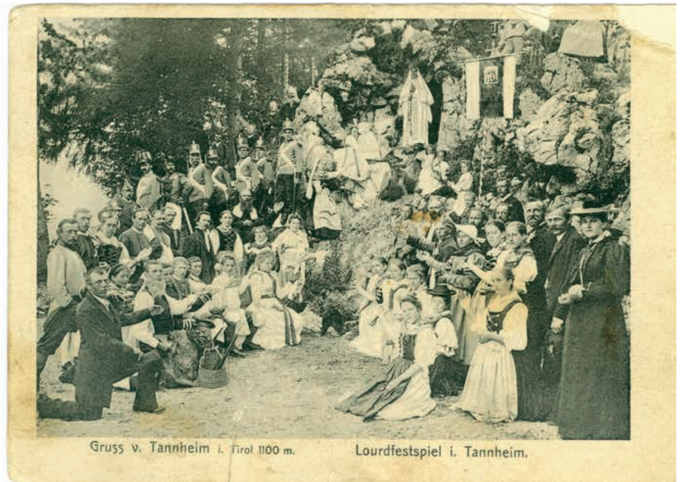
Fotopostkarte des Lourdfestspiels in Tannheim, 1904