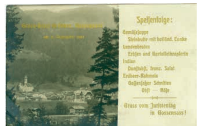
Postkarte zum Juristentag in Gossensass, gleichzeitig Speisekarte, 1904