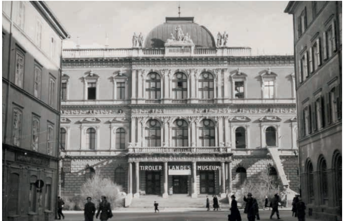
Abb. links: Luftschutzmaßnahmen am Ferdinandeumsgebäude. Abb. rechts: Das Ferdinandeum nach dem Wiederaufbau, um 1955.