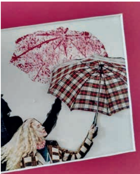
Thema „Silhouetten“ im Offenen Atelier

Dass die Corona-Pandemie unser Leben, und damit auch die Kunst und Kultur durcheinander gebracht hat, steht außer Frage. Mit dem plötzlich verordneten Stillstand fand jedoch binnen weniger Tage Kunst und Kultur online statt: Sei es, dass man Wohnzimmerkonzerte oder analoge Führungen auf den sozialen Netzwerken streamen oder Podcasts zu kulturellen Themen anhören konnte. Die bereits digital erprobten Institutionen waren hier klar im Vorteil. Auch wir standen vor der Herausforderung: Wie können wir die Kommunikation zu unserem Stammpublikum halten bzw. neue Interessierte gewinnen, die sich kreativ mit Kunst auseinandersetzen wollen? Wie können wir trotz mangelnder technischer Möglichkeiten von zu Hause aus Online-Workshops entwickeln? Während der Schließung der Tiroler Landesmuseen im März und April fanden insgesamt fünf Online-Ateliers statt. Die Fotostrecken und Impulstexte folgen dem Grundsatz des freien künstlerischen Arbeitens, sollen inspirieren, statt erklären und kreative Prozesse in Gang setzen. Seit der Wiedereröffnung der Museen findet das Offene Atelier nun wieder regelmäßig vor Ort im Ferdinandeum statt, aufgrund der geltenden Sicherheitsmaßnahmen jedoch nur in Kleingruppen. Parallel stellen wir einmal im