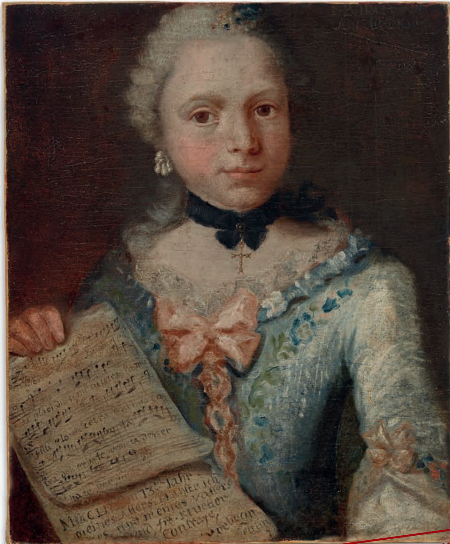
Angelika Kauffmann, Selbstporträt mit Notenblatt, 1753, Öl auf Leinwand, 49,5 x 40,5 cm, Foto: TLM