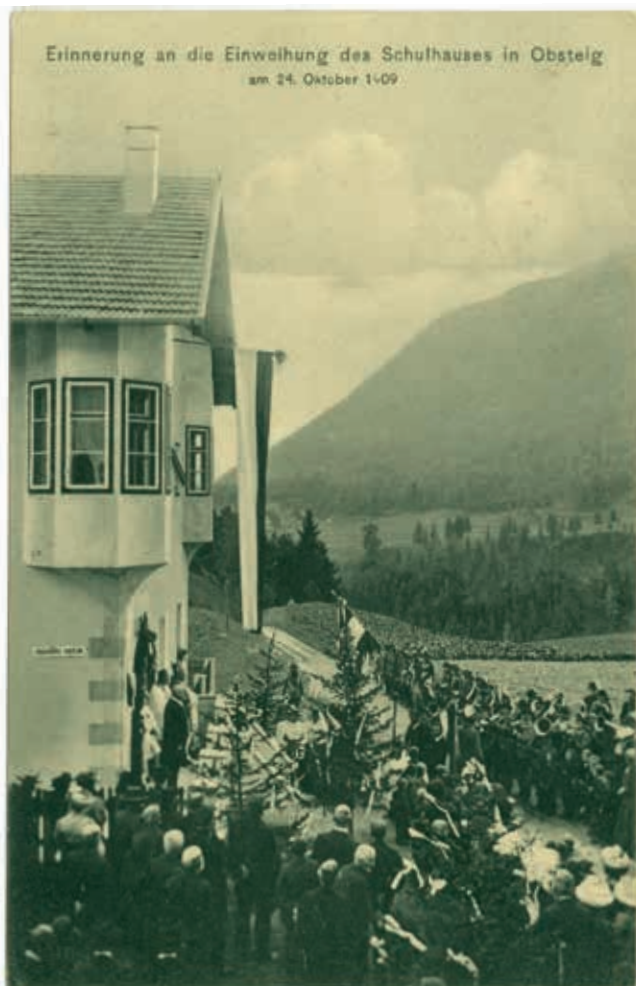
Fotopostkarte zur Einweihung des Schulhauses in Obsteig, 1909

Bevor nun aber noch auf spezielle Besonderheiten der Sammlung eingegangen werden soll, lohnt es sich, einige Eckdaten zur Geschichte der Postkarte zu erfahren.