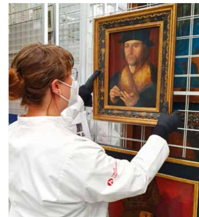
Marx Reichlichs „Kaufmann mit Wachstafelbuch“ am Beginn seiner Reise im Depot des SFZs