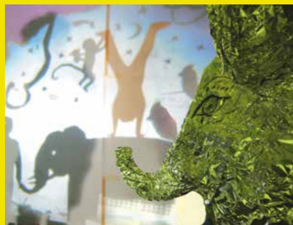
Objekte in stetiger Veränderung

„It's Our Turn“ widmet sich dem Moment der Bewegung in der Kunst, dem Lauf der Dinge, der Veränderung, dem Perspektivenwechsel und der Dimensionsfrage. Betritt man den kleinen Ausstellungsraum im Erdgeschoß des Ferdinandeums, so sieht man im Schein des Lichts die