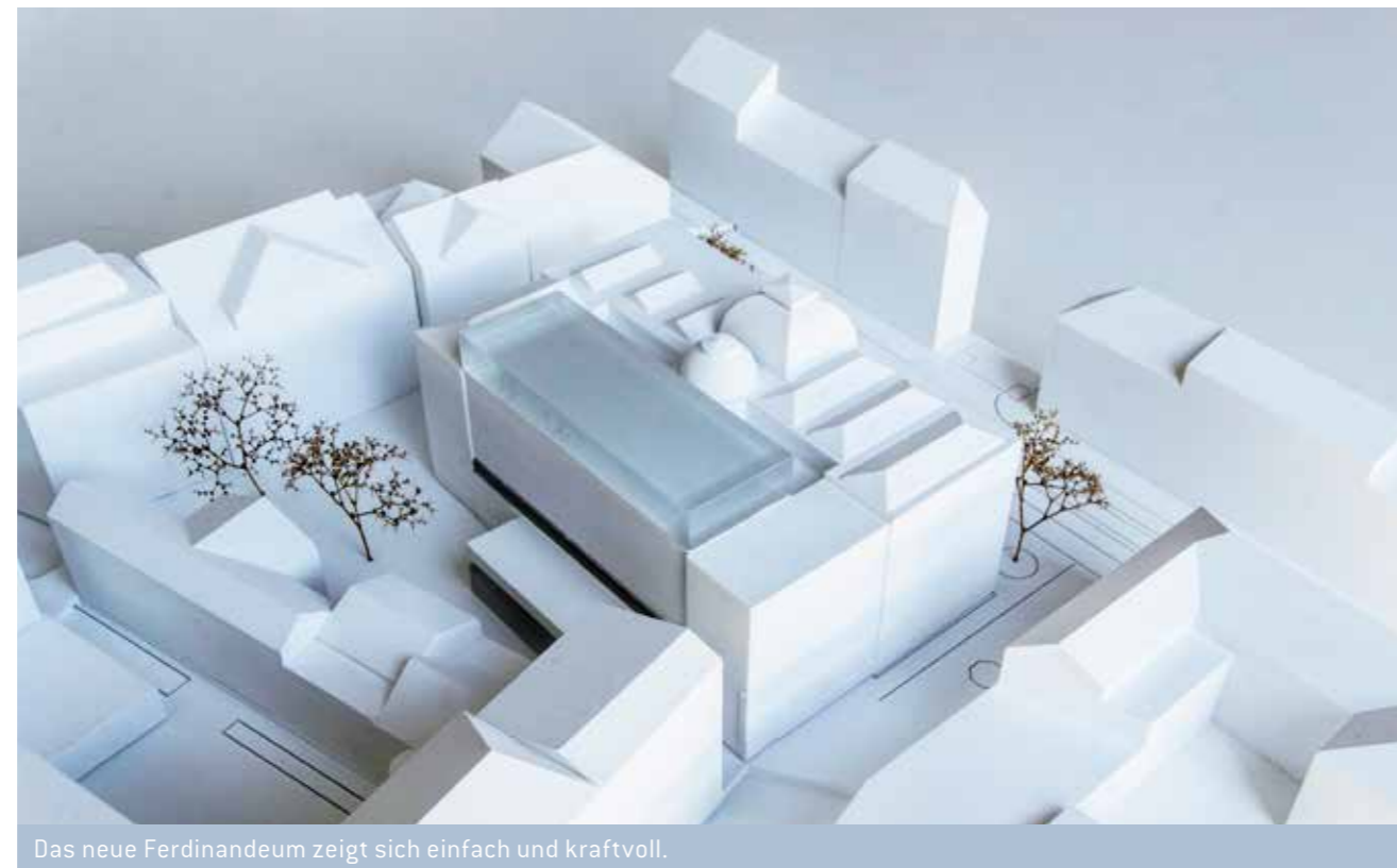
Das neue Ferdinandeum zeigt sich einfach und kraftvoll.

„WIR FREUEN UNS SEHR ÜBER DEN WETTBEWERBSERFOLG. ES ERFÜLLT UNS MIT STOLZ, EIN SO RENOMMIERTES MUSEUM WIE DAS FERDINANDEUM WEITERBAUEN UND MIT ALLEN BETEILIGTEN IN EINE NEUE ZUKUNFT FÜHREN ZU DÜRFEN“.