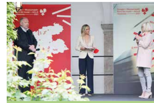
Am 27.5. wurde das Euregio-Museumsjahr 2021 im Kreuzgang des Tiroler Volkskunstmuseums feierlich eröffnet. Neben Peter Assmann und Landesrätin Beate Palfrader waren zahlreiche weitere Vertreter*innen aus Politik, Kultur und Wirtschaft vor Ort.