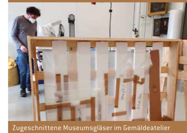
Zugeschnittene Museumsgläser im Gemäldeatelier

Vom 22. Oktober 2021 bis 30. Jänner 2022 findet in Wien die Ausstellung „Dürerzeit. Österreich am Tor zur Renaissance“ statt. Darin werden auch verschiedene Kunstwerke der Tiroler Landesmuseen präsentiert und gewürdigt. Wenn monatelang, manchmal sogar jahrelang vor einer Ausstellung der Leihvertrag zu den angefragten Objekten unterzeichnet ist, beginnt für einige Mitarbeiter*innen der Tiroler Landesmuseen hinter den Kulissen ein Prozess mit vielen Arbeitsschritten. Als Vertreter für die Darstellung einiger interner Abläufe im Sammlungs- und Forschungszentrum (SFZ) im Kontext mit der Ausstellung im Belvedere greifen wir hier das wunderschöne Holztafelbild von Marx Reichlich „Der Kaufmann mit Wachstafelbuch“, um 1515, heraus.