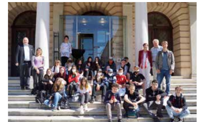
Die Teilnehmer*innen des Schreibwettbewerbs zur Ausstellung „Defregger. Mythos – Missbrauch – Moderne“ bei der Preisverleihung vor dem Ferdinandeum.