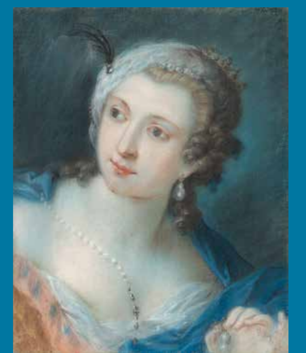
Rosalba Carriera, Porträt einer Dame, um 1730