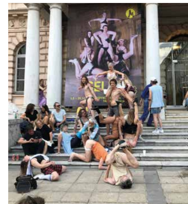
Von 24. bis 26.6. öffnete die Ausstellung Gelatin erstmals ihre Türen und lud zu Musik und Performance.