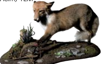
Jagdbares und nicht Jagdbares