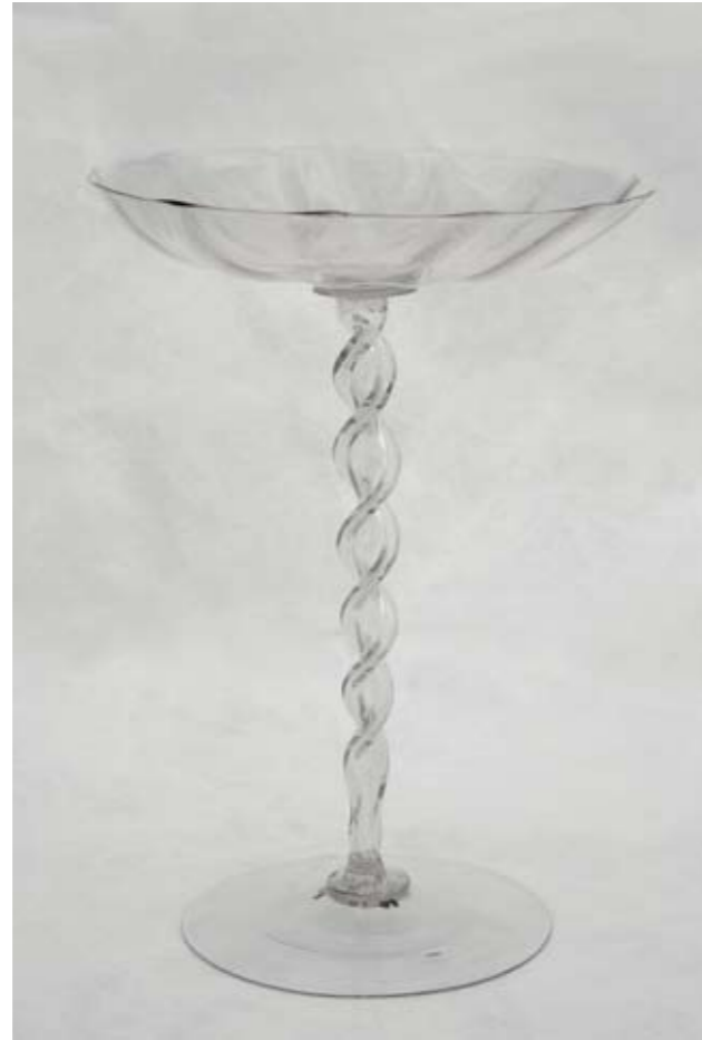
Venedig, Schale auf hohem Fuß, 16. Jh., Foto: Frischauf (Inv.Nr. GL/98)

Zu sehen sind auch venezianische Gläser, die wegen ihrer Dünnwandigkeit und Klarheit begehrte Luxusartikel wurden. Die bizarr gestalteten Schäfte der so genannten Flügelgläser wurden mit der Zange gekniffen. In der Renaissance schmückte man die Gläser mit Emailmalerei, Diamantgravur sowie gedrehten und geflochtenen Fadendekoren. Nördlich der Alpen bevorzugte man im 16. und 17. Jahrhundert für Trinkgelage Stangengläser, Humpen sowie Scherz- und Vexiergläser, die das Trinken zum Gesellschaftsspiel erhoben. Eine Reihe exquisiter Barockgläser zeugt von der hohen künstlerischen Qualität der Glasschneider. Die edle Form des Pokals begann die übrigen Trinkgefäße auf den Festtafeln zu verdrängen. 1680 wurde in Böhmen das kristallklare Kreideglas erfunden. Rohgläser gelangten als Exportware in das benachbarte Schlesien, wo die Glasschneidekunst ebenfalls eine Blütezeit erlebte. Darüber