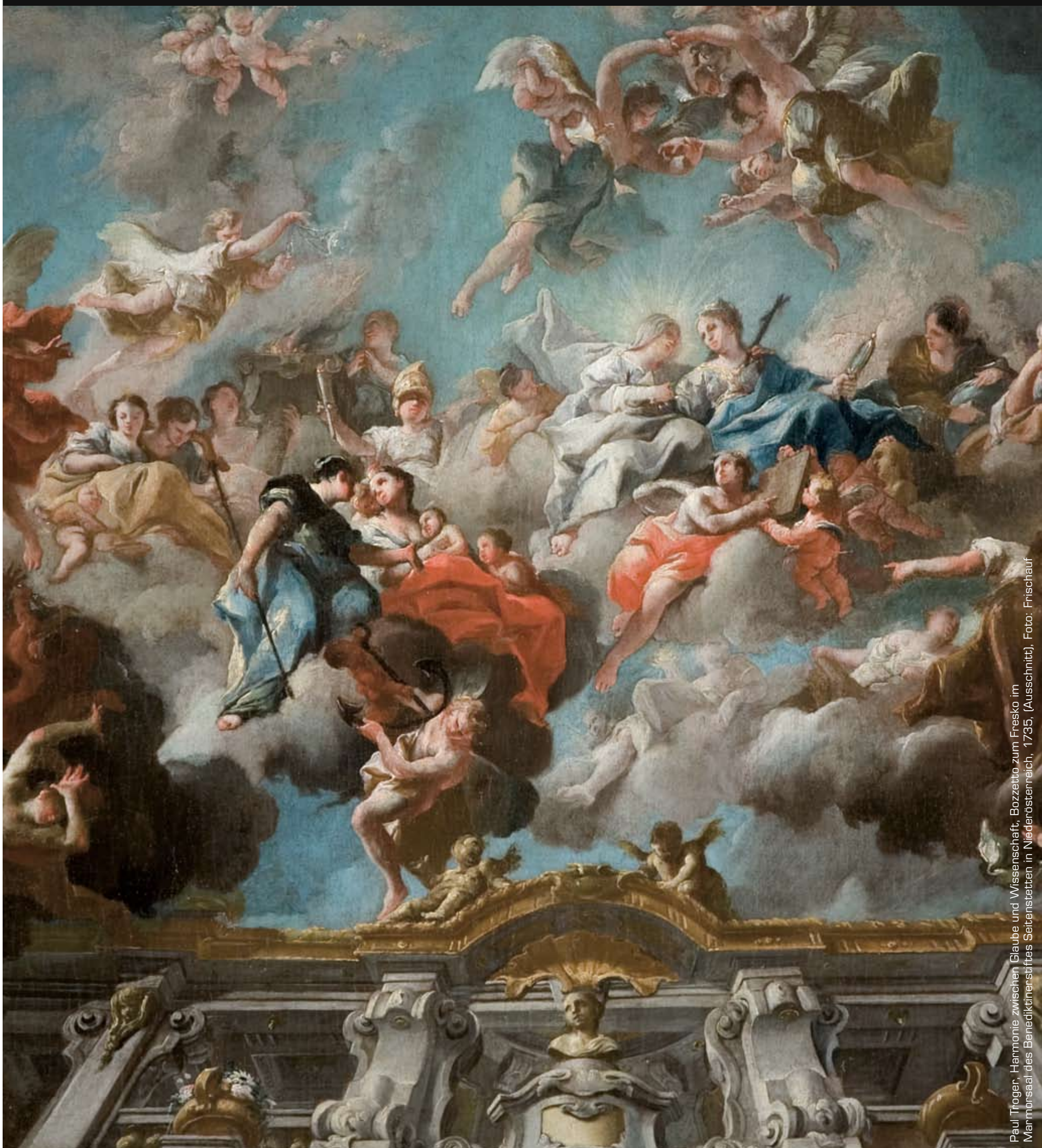
Paul Troger: Harmonie zwischen Glaube und Wissenschaft; Bozzetto zum Fresko im Marmor-saal des Benediktinerstiftes Seitenstetten in Niederösterreich, 1735. (Ausschnitt)