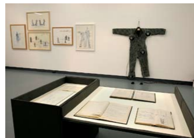
Raumansicht Art Box mit Leitners TonRaumSkulpturen

die Beziehungen zwischen Klangkunst und Baukunst. Die Ausstellung zeigt einen Überblick über Leitners Schaffen, angefangen von den frühen Ton-Raum-Untersuchungen der 1960er Jahre bis herauf zu den jüngsten Ton-Raum-Skulpturen. Zur Ausstellung erscheint ein gleichnamiger Katalog (95 Seiten, zahlreiche Farbbildungen), der im Museumshop um EUR 14,- zu erwerben ist.