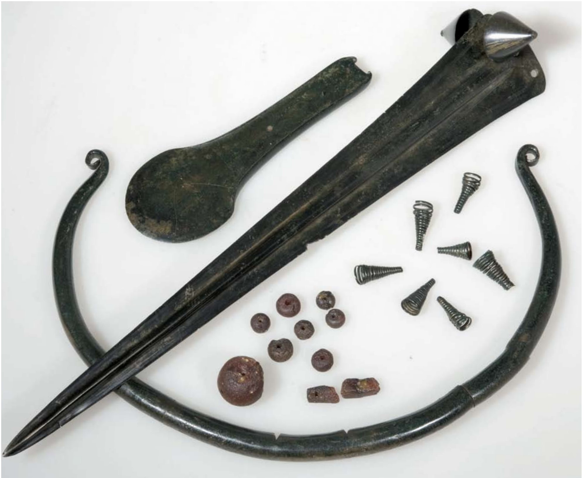
Weihefund von Ried im Oberinntal (Bezirk Landeck), 17. Jahrhundert v. Chr. Dolchstabklinge, Randleistenbeil, Ösenhalsring, Spiraltutuli, Bronze, Perlen und Bruchstücke von Perlenschieber, Bernstein TLMF, Vor- und Frühgeschichtliche und Provinzialrömische Sammlungen, Inv.Nr. U 1130-1150