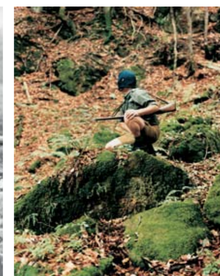
August Dieffenbacher: Flucht des Wilderers, 1988, Staatliches Museum Schwerin