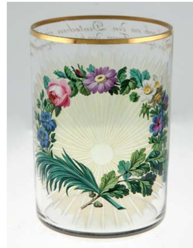
Wien, Anton Kothgasser, Akrostichonbecher, um 1815 (Inv.Nr. GL/291)

veredelung dieser Zeit ist der Rauten-, Rosetten-, Linsen-, Walzen- Kugel- oder Steindschliff. Besonderer Beliebtheit erfreuten sich die so genannten Überfanggläser. Böhmisches Hütten entwickelten neben buntem, in der Masse gefärbtem, durchscheinendem Glas auch Opakglas, wie das rote und schwarze Hyalithglas und das milchig weiße Opakglas. Besondere Effekte wurden auch durch Lasuren oder Beizen erzielt, wie das von Friedrich Egermann erfundene kunstvolle Lithyalinglas.