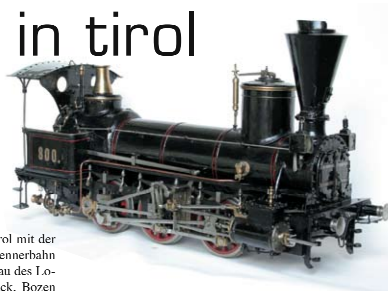
Plakat der Pustertalbahn, hg. von der k.k. priv. Südbahn-gesellschaft, Chromolithographie, unbezichnet, gegen 1900 (Ausschnitt)

Die Ausstellung streift über die Pionierzeit im Eisenbahnwesen hinaus die Entwicklung bis heute – 150 Jahre Eisenbahn in Tirol. Am 24.11.1858 wird die Bahnlinie von München über Kufstein nach Innsbruck eröffnet. Durchgehend in Nord-Süd-Richtung befahrbar ist Tirol mit der Eröffnung der als „Weltbahn“ bezeichneten Brennerbahn ab August 1867. Ab 1880 arbeitet man am Ausbau des Lokalbahnnetzes, das sich um die Städte Innsbruck, Bozen und Trient konzentriert. Diesen Bahnen kommt in erster Linie wirtschaftliche Bedeutung zu. Unvergessen sind in diesem Zusammenhang Namen wie Alois von Negrelli, Carl von Etzel, Achilles Thommen, Julius Lott u.v.m. von denen schwierige technische Probleme des Bahnbaus im gebirgigen Land bewältigt worden sind. Auch der „Mas-sen-tourismus“ setzt in Tirol mit der Eisenbahn ein und wird in der Ausstellung beleuchtet.