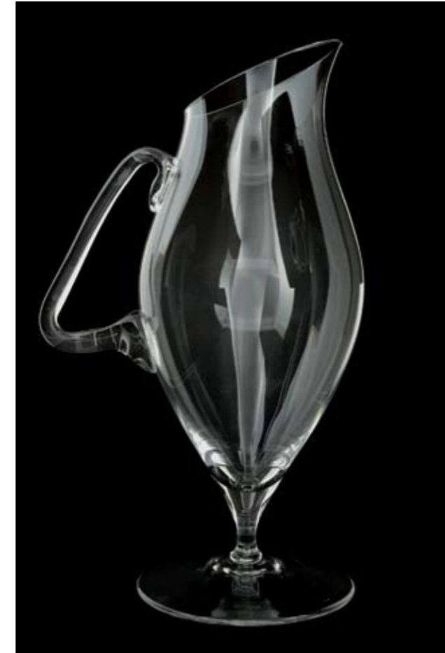
Krug, Tiroler Glashütte Riedel, 1958

veredelung dieser Zeit ist der Rauten-, Rosetten-, Linsen-, Walzen- Kugel- oder Steindschliff. Besonderer Beliebtheit erfreuten sich die so genannten Überfanggläser. Böhmisches Hütten entwickelten neben buntem, in der Masse gefärbtem, durchscheinendem Glas auch Opakglas, wie das rote und schwarze Hyalithglas und das milchig weiße Opakglas. Besondere Effekte wurden auch durch Lasuren oder Beizen erzielt, wie das von Friedrich Egermann erfundene kunstvolle Lithyalinglas.