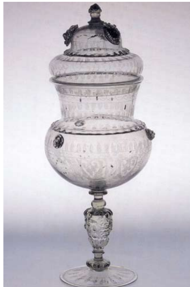
Innsbrucker Hofglashütte, Vasenpokal mit Deckel, um 1572/82, (Inv.Nr. GL/315)