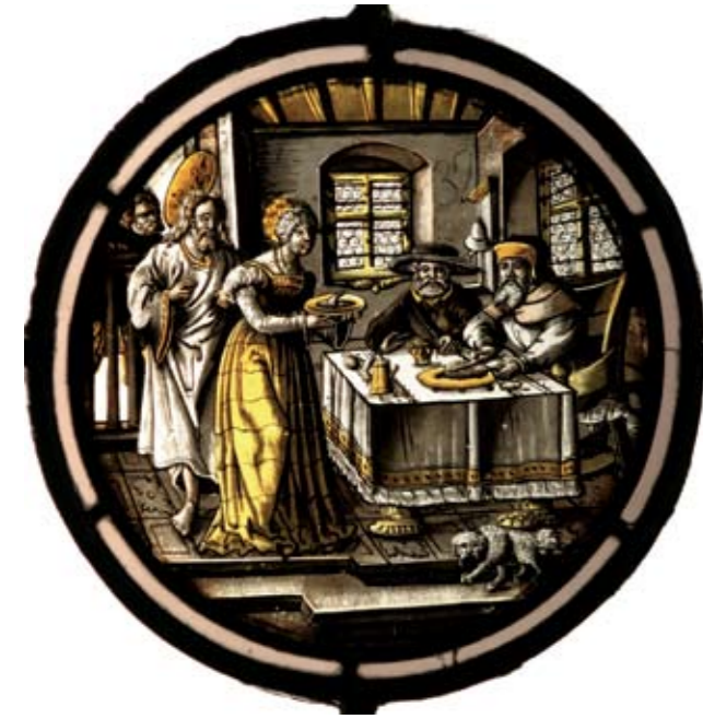
Augsburg, Rundscheibe mit der Darstellung der Speisung der Hungernden nach einer Stichvorlage von Jörg Breu d. Ä., um 1530/40, Foto: Christina Wolf (Inv.Nr. GL/520)