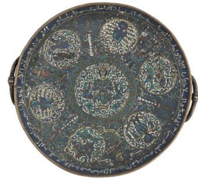
Arduidenschale, 1. H. 12. Jh. (Inv.Nr. K/1036)