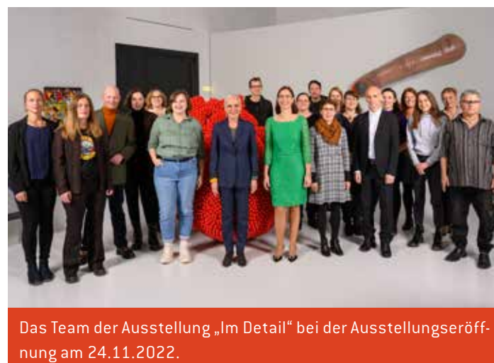
Das Team der Ausstellung „Im Detail“ bei der Ausstellungseröffnung am 24.11.2022.