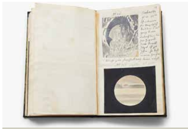
Eines der Astronomischen Tagebücher des Südtiroler Physikers Max Valier aus dessen Nachlass.