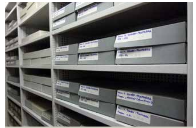
Ein Blick in den Aufbewahrungsort eines kleinen Teiles der Nachlässe.