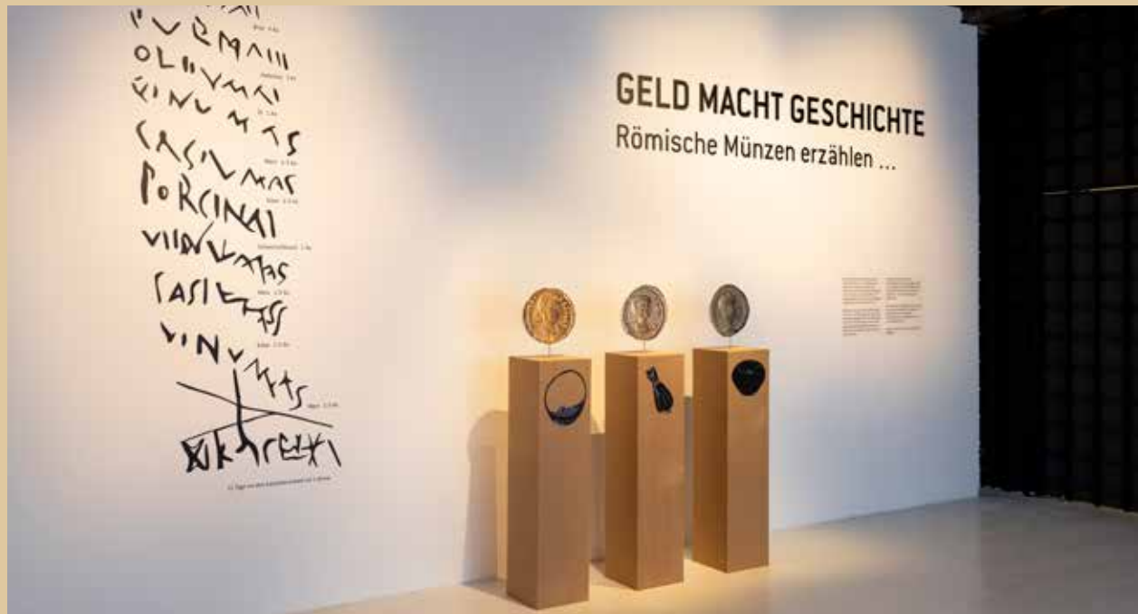
Im Eingangsbereich der Ausstellung kann man drei vergrößerte Münzen – in Gold, Silber und Bronze – im Detail betrachten.