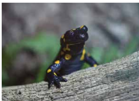
Ein Salamander im Alpenzoo, der die Besucher:innen der Langen Nacht der Museen 2022 beobachtet.