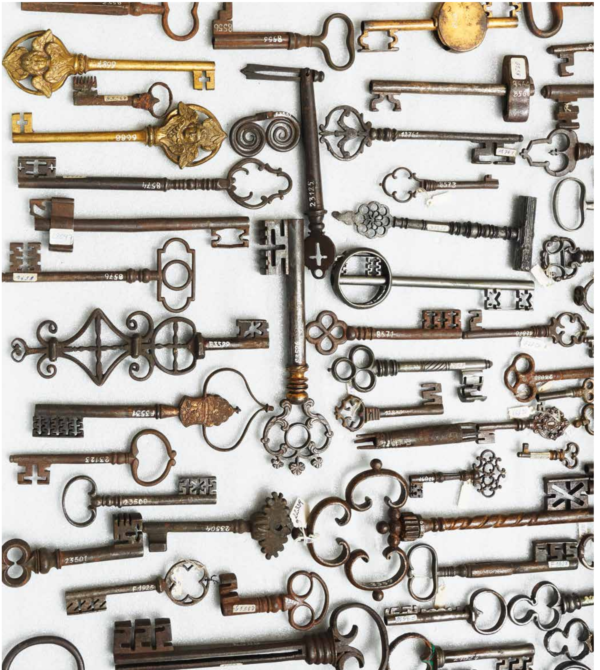
Historische Schlüssler aus der Sammlung des Tiroler Volkskunstmuseums. Fotografiert für die Ausstellung „Im Detail“. Noch bis 25. Juni im Ferdinandeum.

DIE ZEITUNG DES VEREINS TIROLER LANDESMUSEUM FERDINANDEUM FERDINANDEA NR. 62 · FEBRUAR–APRIL 2023