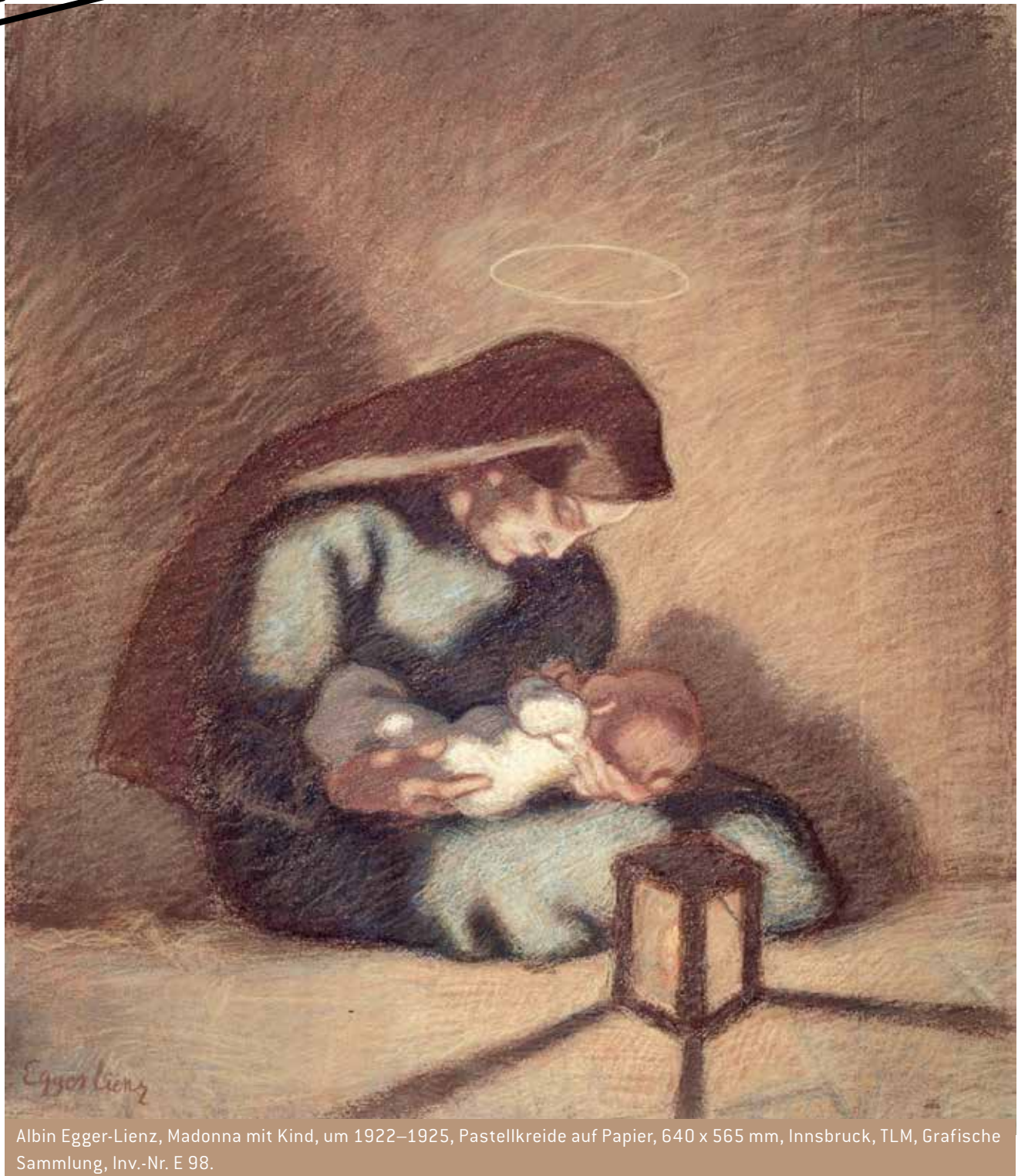
Albin Egger-Lienz, Madonna mit Kind, um 1922–1925, Pastellkreide auf Papier, 640 x 565 mm, Innsbruck, TLM, Grafische Sammlung, Inv.-Nr. E 98.