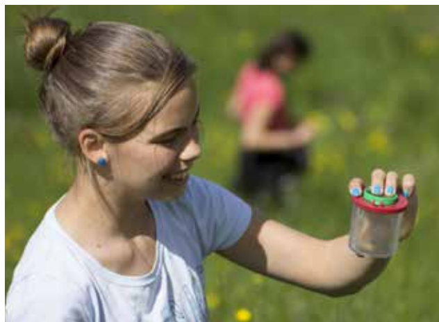
Das beobachten von Tagfalter begeistert auch junge Menschen für Natur und Biodiversität.

größere Vielfalt in den Europaschutzgebieten. Noch nie wurden in Tirol so konsequent Bestandsdaten von Tagfaltern erhoben und es überrascht daher nicht, dass ähnliche Projekte inzwischen in Vorarlberg und auch in Südtirol gestartet wurden.