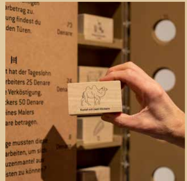
Hat 301 n. Chr. ein Kamel mit zwei Höckern oder ein Kapuzenmantel aus Noricum mehr gekostet? Die Lösung finden Sie in der Sonderausstellung „geld macht geschichte“.

Last, but not least geht es bei der vierten Hands-on-Station