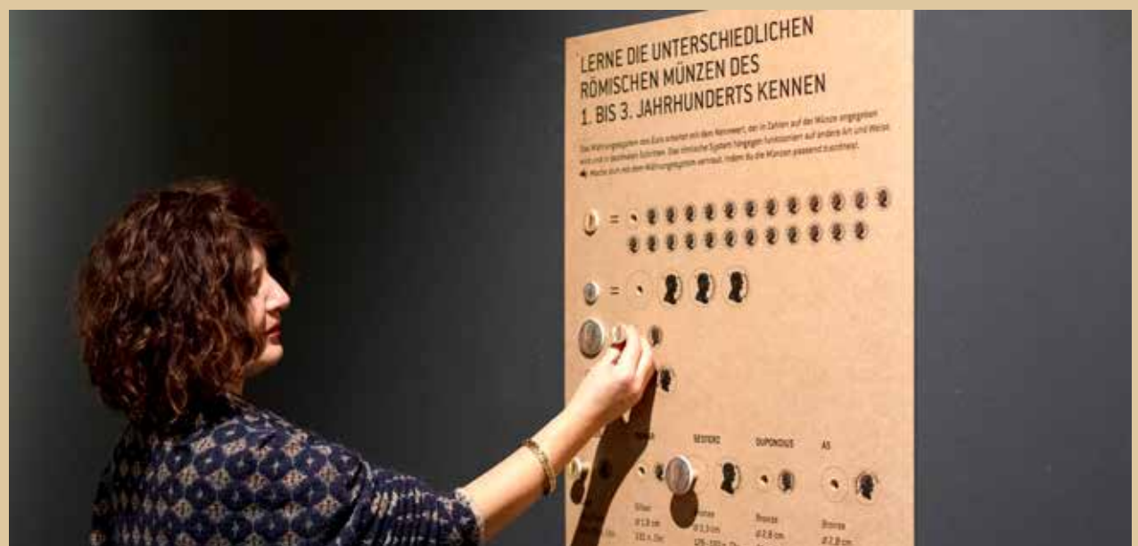
Auf den römischen Münzen ist kein Nennwert dargestellt. Wie kann man sie unterscheiden?

Und die Unterteilung war auch nicht so einfach: 1 Aureus war 25 Denare wert; 1 Denar entsprach 4 Sesterzen, 1 Sesterz war 2 Dupondien wert usw. ... Schon ziemlich schwierig! Deshalb laden wir Besucher:innen jeden Alters ein, dieses spielerisch inszenierte Rechenspiel in der Ausstellung selbst auszuprobieren!