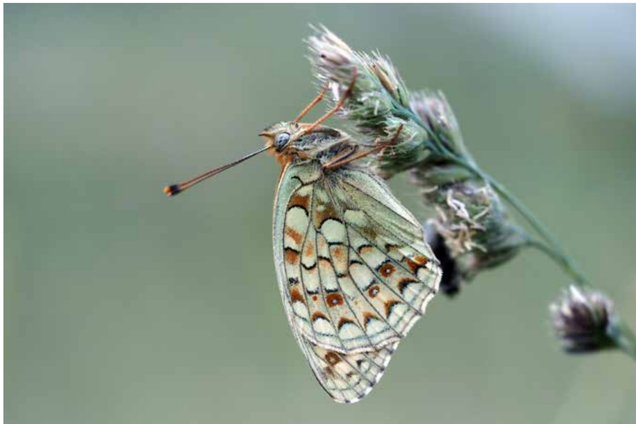
Der Mittlere Perlmutterfalter ist eine der leicht zu verwechselnden Tagfalterarten Tirols.