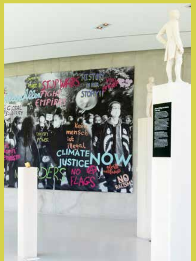
Petra Gerschner, fragments of future, 2022, aus der Serie „history is a work in process“.

Innovative Museen entwickeln sich zunehmend zu Räumen, in denen gesellschaftspolitische Herausforderungen partizipativ, manchmal widersprüchlich, jedoch niemals konfliktscheu diskutiert werden. Mehr noch: Sie werden Akteure, die auf die Gesellschaft und die Umgebung zurückstrahlen. Die musealen Objekte werden dadurch aber keinesfalls zur Nebensache deklassiert, im Gegenteil: Sie rücken verstärkt ins Zentrum und entfalten eine gesamtheitliche Relevanz – mit den historischen Kontexten verbunden, doch aus der Gegenwart heraus betrachtet. „Museum“ ist nicht lediglich ein Ort, sondern ein sich stets entwickelnder Prozess.