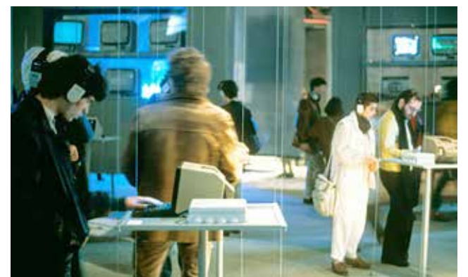
Die Ausstellung „Les Immatériaux“, Centre Pompidou, Paris, 1985.

In den 1980er-Jahren erlebten viele Museen in der ganzen Welt ein neues Interesse an Szenografie. Bühnenbildner:innen, die im Theater und in der Filmindustrie bereits tätig waren, wurden in große Ausstellungsprojekte eingebunden. Die 1985 vom französischen Philosophen Jean-François Lyotard