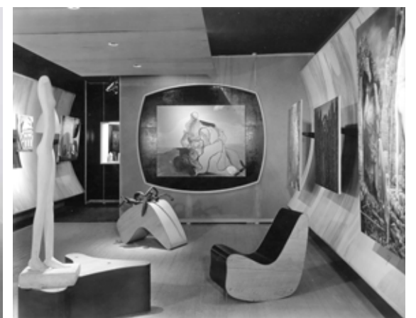
Abb. li.: Giulio Camillo, Gedächtnistheater, 1519–1544. Abb. Mitte: Die Skulptur von Picasso, Ausstellungsansicht, Fotografie, 1967. Abb. re.: Friedrich Kiesler, Art of This Century Gallery, 1942.