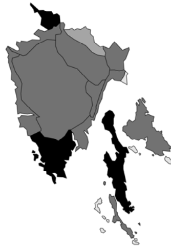
Abb. 148: Teucrium chamaedrys subsp. chamaedrys