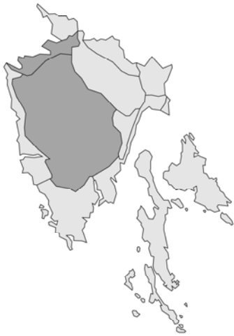
Abb. 159: Thymus praecox subsp. praecox