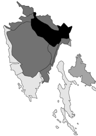
Abb. 50: Lamium orvala