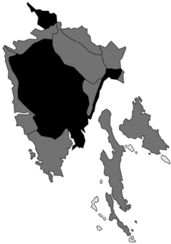
Abb. 49: Lamium maculatum