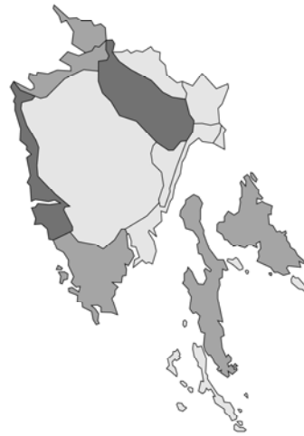
Abb. 28: Clinopodium vulgare subsp. vulgare