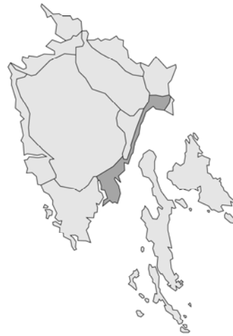
Abb. 34: Galeopsis angustifolia subsp. inermis