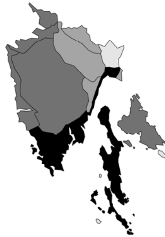
Abb. 106: Salvia bertolonii