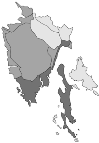
Abb. 105: Rosmarinus officinalis