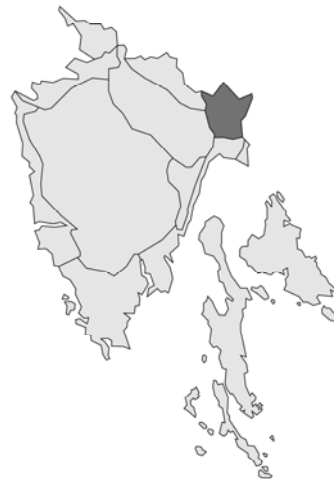
Abb. 42: Glechoma hederacea var. hederacea