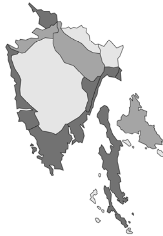
Abb. 16: Clinopodium acinos subsp. villosum