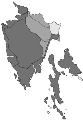
Abb. 103: Prunella laciniata