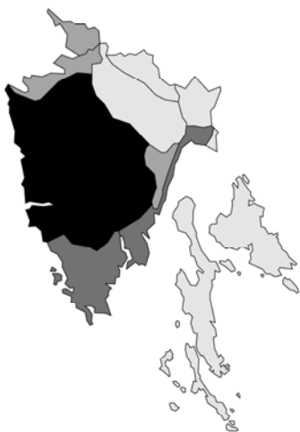
Abb. 77: Mentha microphylla