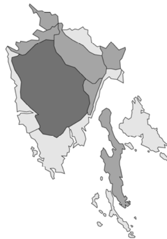
Abb. 30: Galeobdolon luteum