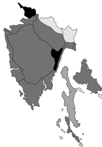
Abb. 120: Satureja montana subsp. montana