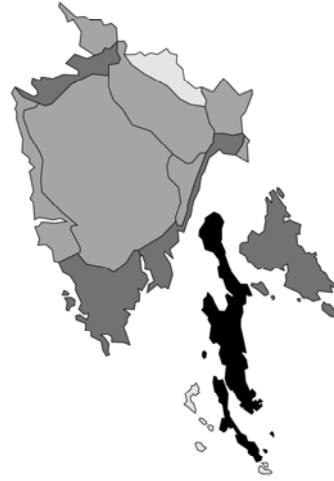
Abb. 142: Stachys subcrenata