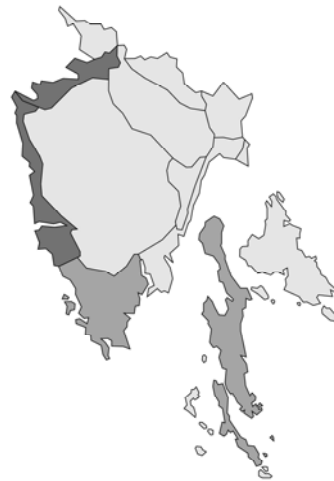
Abb. 150: Teucrium fruticans