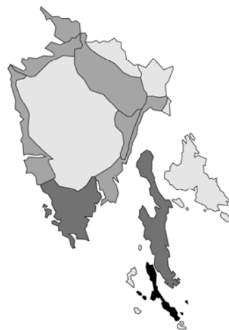
Abb. 18: Clinopodium ascendens