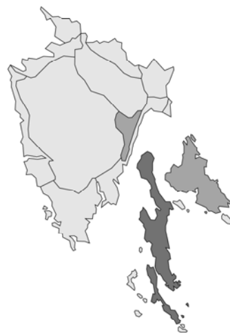
Abb. 156: Thymus hirsutus