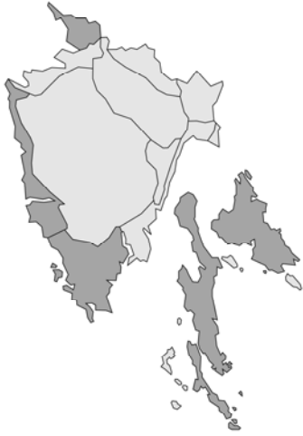
Abb. 3: Ajuga chamaepitys subsp. chia