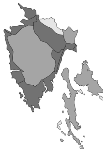
Abb. 138: Stachys recta