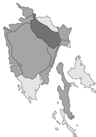
Abb. 66: Melittis melissophyllum subsp. albida