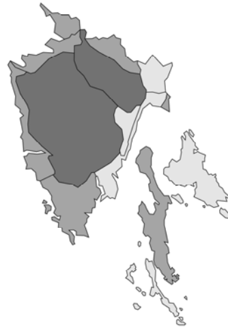
Abb. 32: Galeopsis angustifolia