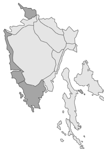
Abb. 96: Origanum majorana