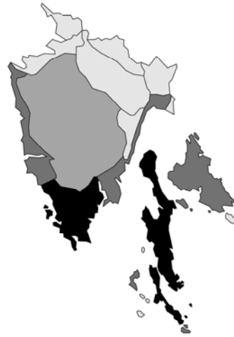
Abb. 128: Sideritis romana