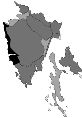
Abb. 14: Betonica officinalis subsp. serotina