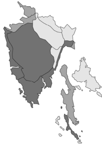
Abb. 2: Ajuga chamaepitys subsp. chamaepitys