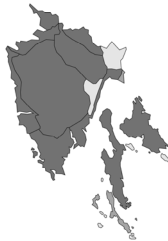
Abb. 104: Prunella vulgaris