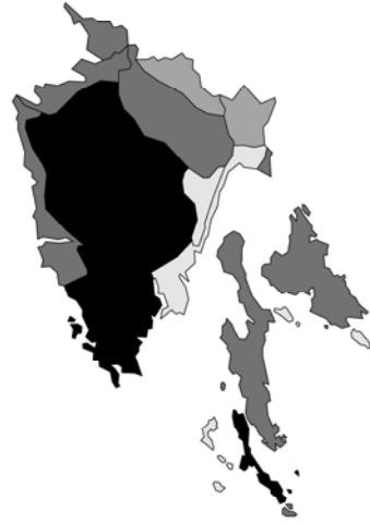
Abb. 4: Ajuga genevensis