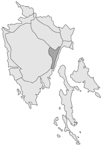
Abb. 145: Teucrium arduini