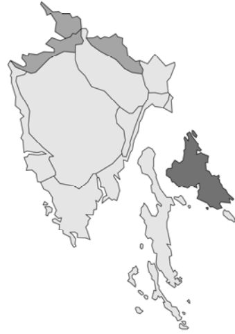
Abb. 58: Lycopus europaeus subsp. mollis