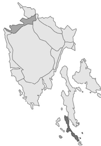
Abb. 132: Stachys arvensis