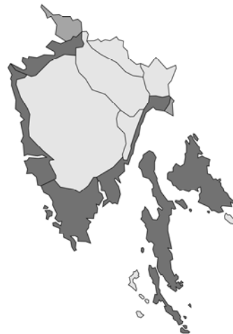
Abb. 168: Vitex agnus-castus