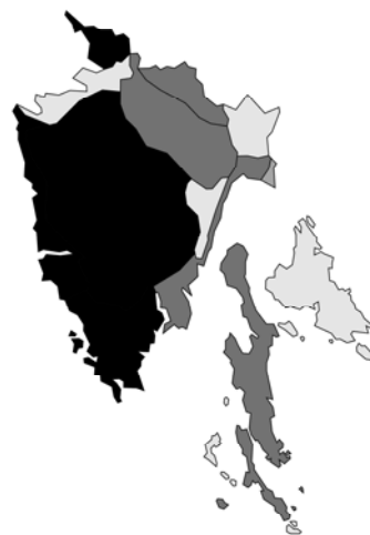
Abb. 48: Lamium amplexicaule subsp. amplexicaule