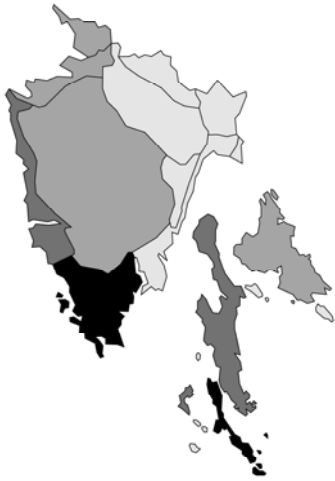
Abb. 115: Salvia verbenaca