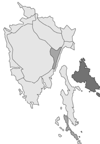
Abb. 166: Thymus striatus