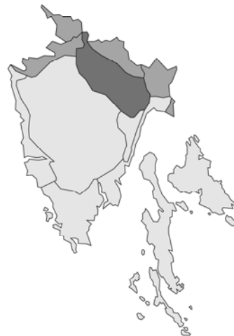
Abb. 40: Galeopsis tetrahit