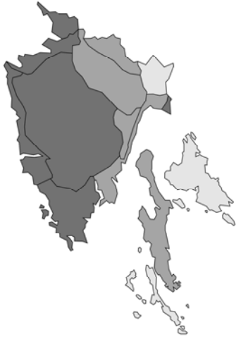
Abb. 9: Ballota nigra subsp. meridionalis