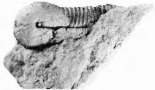
Fig. 2 b