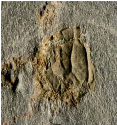
Abb. 1: Corrugatagnostus cf. refragor PEK 1969; Kiesbert-Tonschiefer-Formation von Kiesbert. - Stark verdrücktes, fragmentarisches Pygidium mit Resten eines Thorax-Segmentes, Gesamt-Länge = 4,0 mm; coll. Koch, UT.K.T33.

Material / Erhaltung: Aus der Kiesbert-Tonschiefer-Formation von Kiesbert liegt ein stark verdrücktes, fragmentarisches Pygidium mit Resten eines Thorax-Segmentes vor (Positiv- und Negativplatte, aufbewahrt in der Priv.-Sammlung L. Koch, Samml.-Nr. UT.K.T33).