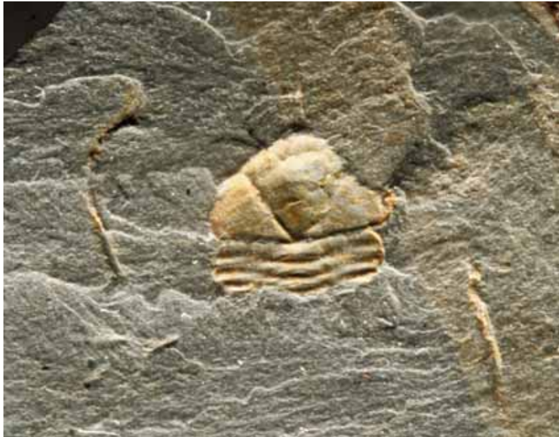
Abb. 5: Raphiophorinae gen. et sp. indet.; Kiesbert-Tonschiefer-Formation von Kiesbert. – Deformierter Cephalo-Thorax (Negativ-Platte) mit Wangenstacheln, Frontstachel und 3 Thorax-Segmenten, rechter Wangen-Stachel disloziert abseits des Cephalo-Thorax, Gesamt-Länge = 9,0 mm; sichtbarer Cephalo-Thorax = 3,9 mm; Wangenstachel: erhaltene Länge = 5,0 mm.; LWL-Museum für Naturkunde Münster, P58683b.

Maße: Gesamt-Länge = 9,0 mm; sichtbarer Cephalo-Thorax = 3,9 mm; Wangenstachel: erhaltene Länge = 5,0 mm.