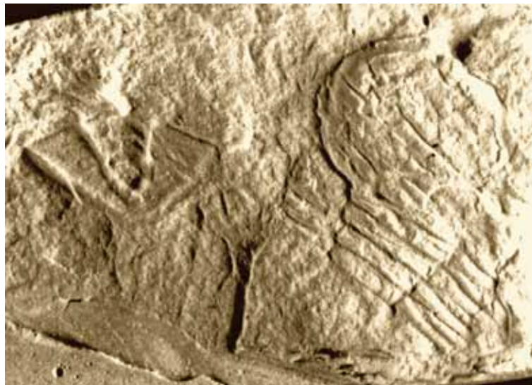
Abb. 3: Pricyclopogyge binodosa (SALTER 1859); Plettenberg-Bänderschiefer-Formation von Köbbinghausen. - Gips-Abguss eines zerfallenen Panzers mit erhaltenem Cephalon und 4 Thorax-Segmenten sowie isoliert eingebettetem Pygidium, Gesamt-Länge (sag.) Cephalo-Thorax = 12,0 mm; Länge (sag.) Pygidium = 5,0 mm; Senckenberg-Museum Frankfurt SMF 11504.