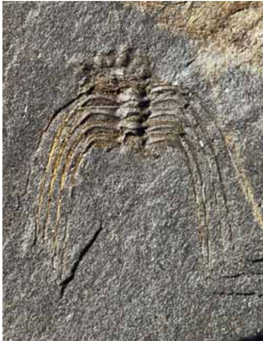
Abb. 6: Selenopeltis macrophthalma (KLOUČEK 1916); Kiesbert-Tonschiefer-Formation von Kiesbert. - Früh-holaspider Panzer mit fragmentarischem Cranium und insgesamt 6 Thorax-Segmenten; Gesamt-Länge (mit Stacheln) = ca. 11mm; LWL-Museum für Naturkunde Münster, P58681b.

Thorax: Überliefert sind die Segmente 1-6. Segment 1 schmäler (sag.) als die folgenden, zusammen mit dem Cranium leicht verschoben und zwischen Cranium und übrigem Thorax nur schlecht erkennbar, da linke Pleure vom Thorax überlagert, Pleural-Stachel nicht erhalten. Segmente 2 bis 6 zusammenhängend; Segment 2 und 3 etwa gleich breit (trans.), danach kontinuierlich nach hinten an Breite abnehmend; Pleuren mit kräftigen, bogenförmigen Rippen, die den oberen Pleuren-Rand nicht erreichen und in sehr langen Pleural-Stacheln auslaufen; Stacheln 2-6 etwa von gleicher Länge.