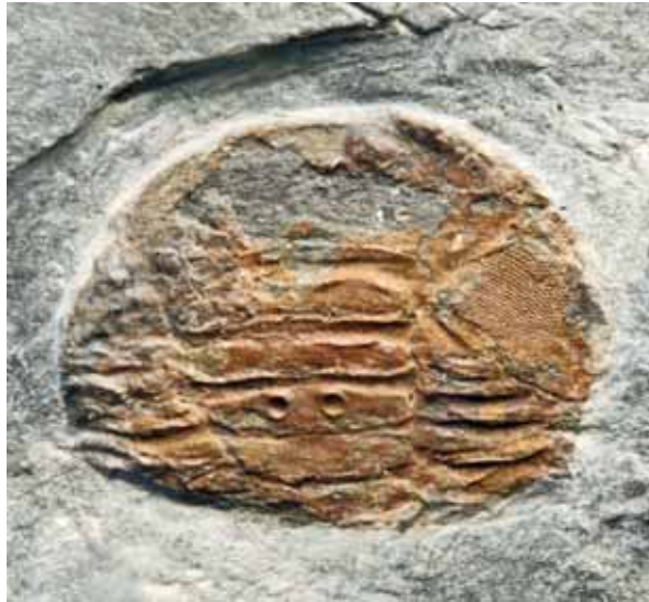
Abb. 2: Pricyclopogyge binodosa (SALTER 1859); Kiesbert-Tonschiefer-Formation von Kiesbert. - Cephalo-Thorax, bestehend aus dem fragmentarischen Cephalon, Teilen beider Augen, den ersten 4 Thorax-Segmenten sowie einem Rest des fünften Segments, Gesamt-Länge = 10,0 mm; LWL-Museum für Naturkunde Münster, P58678.