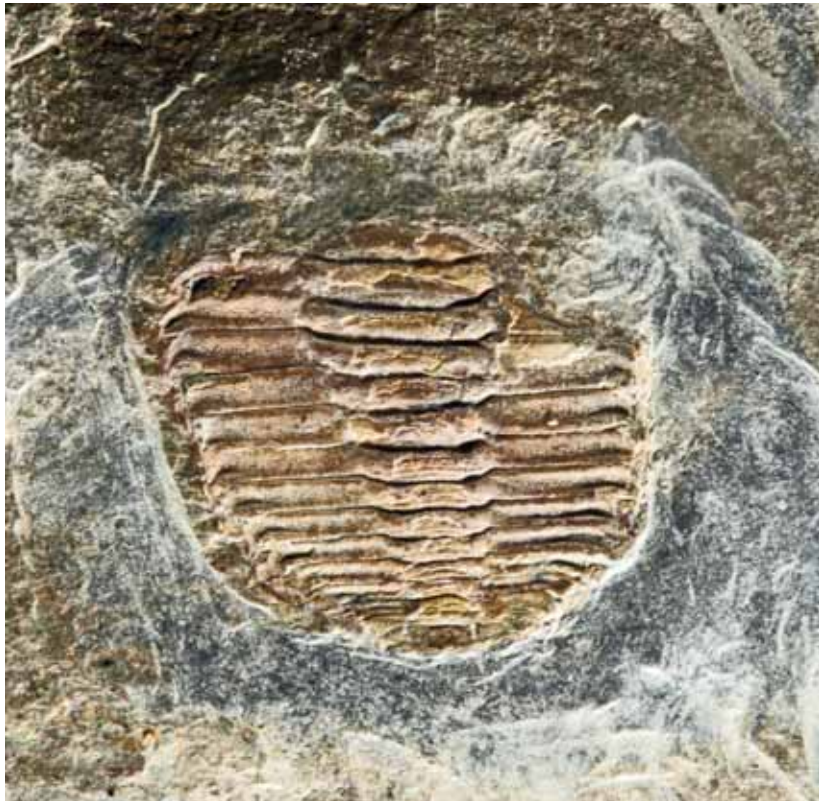
Abb. 4: Eoharpes primus herscheidensis KOCH & LEMKE 1995; Kiesbert-Tonschiefer-Formation von Kiesbert. - Vollständig erhaltenes Thoraco-Pygidium, Gesamt-Länge = 7,9 mm; LWL-Museum für Naturkunde Münster, P58679a.

Beschreibung: Thorax bestehend aus 12 Segmenten. Axis sich rückwärts schnell verjüngend, Axis-Ringe zurückgebogen, gleichmäßig, eine kaum merkliche Depression der Dorsal-Furche querend, in die Pleural-Furche und in die Pleuren-Bänder übergehend. Artikulierender Halbring kräftig, Präannulus durch eine markante Intra-Annular-Furche und eine schwach individualisierte artikulierende Furche abgesetzt. Dorsal-Furchen sehr seicht, nur durch das Verlöschen der Pleuren-Bänder kräftiger erscheinend. Pleuren geradlinig, stets von gleicher Breite (exsag.). Pleural-Furchen sehr breit (exsag.), Boden proximal flach, fast plan, distal stärker eingetieft. Vorderes und hinteres Pleuren-Band etwa gleich breit (exsag.), schienenartig und schmal. Hinteres Pleurenband nur im Übergangs-Bereich zur Axis etwas kräftiger. Vorderes Pleuren-Band lateral scharf abknickend, das Ende der Pleure markierend, und mit dem hinteren Pleuren-Band ein spitz zulaufendes, rückwärts gerichtetes Pleuren-Ende bildend. Skulptur aus feinen, gleichmäßig verteilten Grübchen, auf den Axis-Ringen ausgelängt.