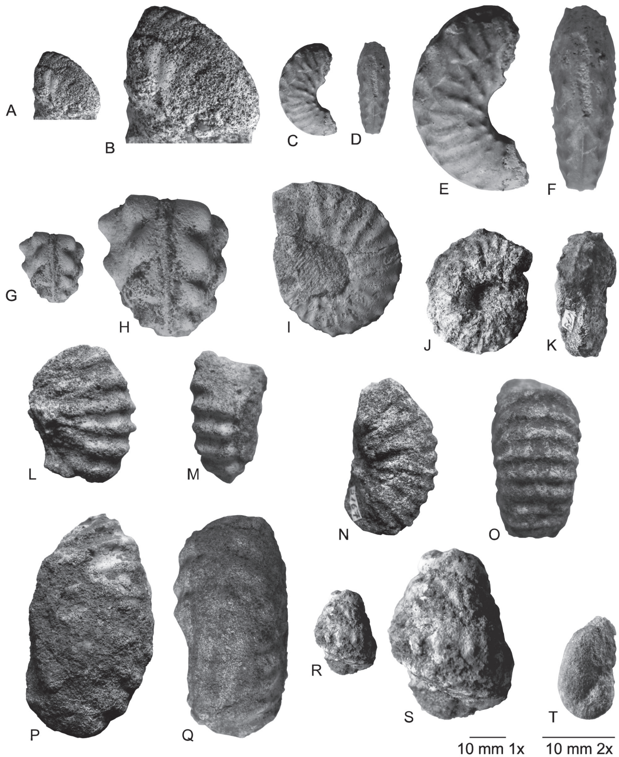
Abb. 5: A-B Hyphoplites falcatus falcatus (Mantell, 1822) A 6301/3;

C-K Schloenbachia varians (J. Sowerby, 1817), C-F A 6512/1, C-D 1x, E-F 2x, G-H A 6318, I 1x, H 2x, I-A 6305 1x, J-K A 6310 1x;