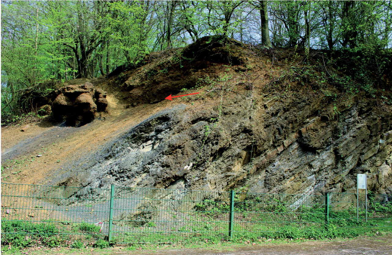
Abb. 3: Auflager des cenomanen Toneisenstein-Feinkonglomerates mit basalen Sandsteingeröllen (roter Pfeil) im Bereich des Ausbisses von Flöz Wasserfall. (Zustand April 2015)

Eine Zusammenstellung der kreidezeitlichen Schichtenfolge aus älterer Literatur geben Ganzelewski et al. (2008, S. 106 – 107). Ergänzt um aktuelle lithostratigraphische Begriffe und einzelne Anmerkungen, folgen wir ihr hier. Die Beschreibung erfolgt vom Liegenden zum Hangenden.