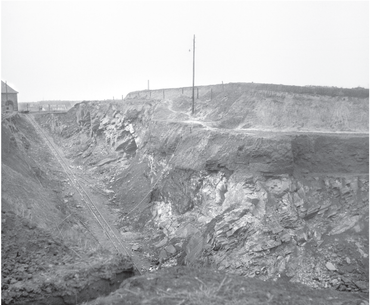
Abb. 2: Historische Aufnahme des Geologischen Gartens von 1936, damals Steinbruch von „Gockel und Niebuhr“ (Fotoarchiv Stiftung Ruhr Museum, Nr. Geol 1315, Glasplatte 6 x 6 cm). In der linken Bildhälfte ist der Bremsberg deutlich sichtbar, über den per Lorenbahn das abgebaute Gestein der Ziegelei zugeführt wurde. Der Bremsberg, heute nordwestlicher Zugang zum „Geologischen Garten“, durchschneidet den Dickebank-Sandstein. Am oberen linken Bildrand noch eben sichtbar befindet sich ein Ziegeleigebäude auf dem heutigen Sportplatzgelände am Schulzentrum Wiemelhausen. In der rechten Bildhälfte ist das diskordante nahezu söhliche Auflager der Essen-Grünsand-Formation über den Karbon-zeitlichen Ablagerungen deutlich erkennbar. Das Planum etwas unterhalb des Telegrafmastes beschreibt die Grenze zwischen den Kreide-Sedimenten und dem quartären Lösslehm.

späten Albium bis ins frühe Turonium transgredierte das Kreidemeer im Ruhrgebiet auf das eingerumpfte Rheinische Schiefergebirge. In dem küstennahen Flachwassermilieu schuf es ein ausgeprägtes Kleinrelief. Harte karbonische Sandsteinfohlen bildeten Klippen und Inseln, während die weicheren Ton-/Siltstein-Abfolgen mit den darin eingelagerten Steinkohleflözen verstärkt erodiert wurden. In diesen Erosionsbereichen lagerten sich Basiskonglomerate aus gerundetem Sandstein, aufgearbeiteten, feinkörnigerem Ton-/Siltstein und Bruchstücke karbonischer Toneisensteingeoden ab (Abb. 3). Sie bildeten die Basis der Essen-Grünsand-Formation. Erst mit steigendem Meeresspiegel wurde der glaukonitische und häufig fossilreiche eigentliche Essen-Grünsand sedimentiert (Hiss 1995). Diese Transgressionsgeschichte ist im „Geologischen Garten“ musterhaft erhalten. Ähnliche Verhältnisse sind im Ruhrgebiet sonst lediglich im