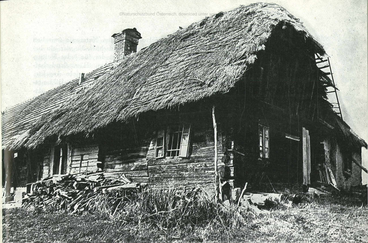
Wie dieses verfallen jährlich ungezählte Bauernhäuser in Österreich.