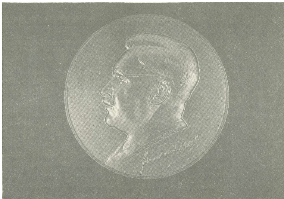
Eduard Paul Tratz-Medaille