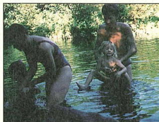
Badevergnügen an der Mühl