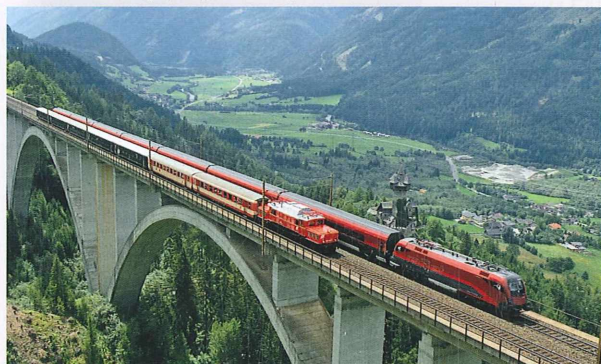
Nord-Süd-Korridor der Tauernstrecke