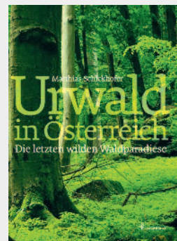
Fotoband von Matthias Schickhofer. Christian Brandstätter Verlag, 141 Seiten, EUR 29,90

Der Buchkalender begleitet Vogelbeobachter durchs ganze Jahr. Die Aquarelle und Zeichnungen von Vogelporträts und Landschaften stammen von Dan Zetterström, einem der besten Vogelzeichner der Welt. Stimmungsvoll illustrieren sie die Arten in ihrem Lebensraum und ihr Kommen und Gehen zu den Vogelzugzeiten. Das Wochenkalendarium bietet viel Raum für eigene Beobachtungen, Begegnungen und Erlebnisse. Mit wertvollen Tipps zur Vogelbeobachtung und ein ideales Geschenk!