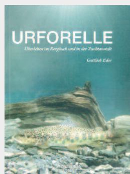
Gottlieb Eder. Tauriska Verlag, 232 Seiten, zahlreiche Fotos, EUR 24,90

Das Buch bietet erstmals einen umfassenden Überblick der Klimawandeleffekte auf die Biodiversität in Mitteleuropa. Dabei nehmen die Bewertung der beobachteten und prognostizierten Folgen des Klimawandels auf Arten und Lebensräume einen zentralen Raum ein. Auf die Ableitung von Handlungsoptionen unter der Leitlinie des frühzeitigen Handelns und der Risikovorsorge wird besonders eingegangen. Auch Querverbindungen zu menschlichen Aktivitäten, wie Land- und Forstwirtschaft, Jagd und Fischerei, werden gezogen und die Auswirkungen auf Gesundheitsvorsorge und ökosystemare Leistungen dargestellt. Ergebnisse von Fallstudien werden zur anschaulichen Darstellung der Zusammenhänge präsentiert. Dieses von über 70 Autoren gemeinsam verfasste Werk ist eine unentbehrliche Faktensammlung für jeden, der die Auswirkungen des Klimawandels auf die biologische Vielfalt in Mitteleuropa verstehen möchte.