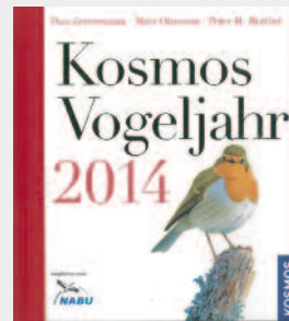
Dan Zetterström & Mats Ottoson & Peter H. Barthel, Kosmos Verlag, 160 Seiten, EUR 16,99 Empfohlen vom NABU!

Der Autor, ein passionierter Fischer und Biologielehrer i. R., schildert das Leben einer weiblichen Bachforelle, genannt die Rotgetupfte. Wetterelemente, Koppfen, räuberische Libellenlarven und die Nachstellungen eines jugendlichen Schwarzfischers bedrohen ihre Entwicklung im prickelnden Tauernbach. Als Wissenschaftler im Rahmen eines länderübergreifenden Projekts („TroutExamInvest“) ihr außergewöhnliches Erbgut entdecken, wird sie elektrisch ausgefischt und wechselt als Muttertier in eine Zuchtanstalt. Der neue Lebensraum belastet das Wildtier. Der Anpassungsdruck und das Prozedere des Abstreifens machen der Forelle derart zu schaffen, dass sie stirbt. Ausgewogen verwebt der Autor Wissen, Abenteuer und Fantasie in seiner Geschichte über die heimische Bachforelle.