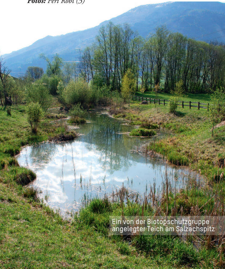
Ein von der Biotopschutzgruppe angelegter Teich am Salzachspitz