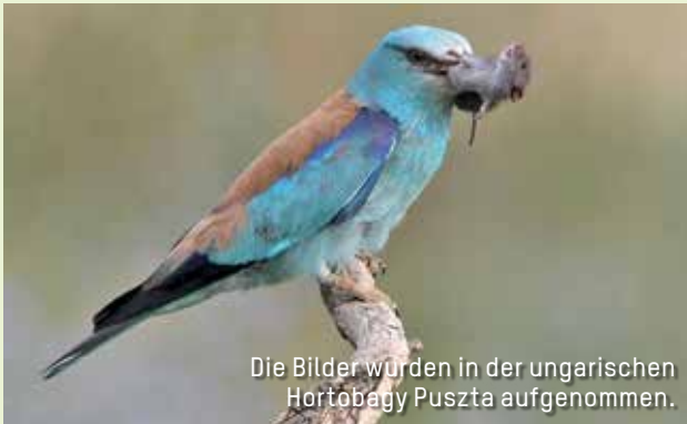
Die Bilder wurden in der ungarischen Hortobágy Puszta aufgenommen.

Gab es in der Mitte des 20. Jahrhunderts in Österreich allein in der Steiermark noch fast 300 Brutpaare, ist der Bestand heutzutage auf dieses winzige Restvorkommen zusammengeschrumpft. Die Anzahl der Brutpaare ist stark rückläufig.