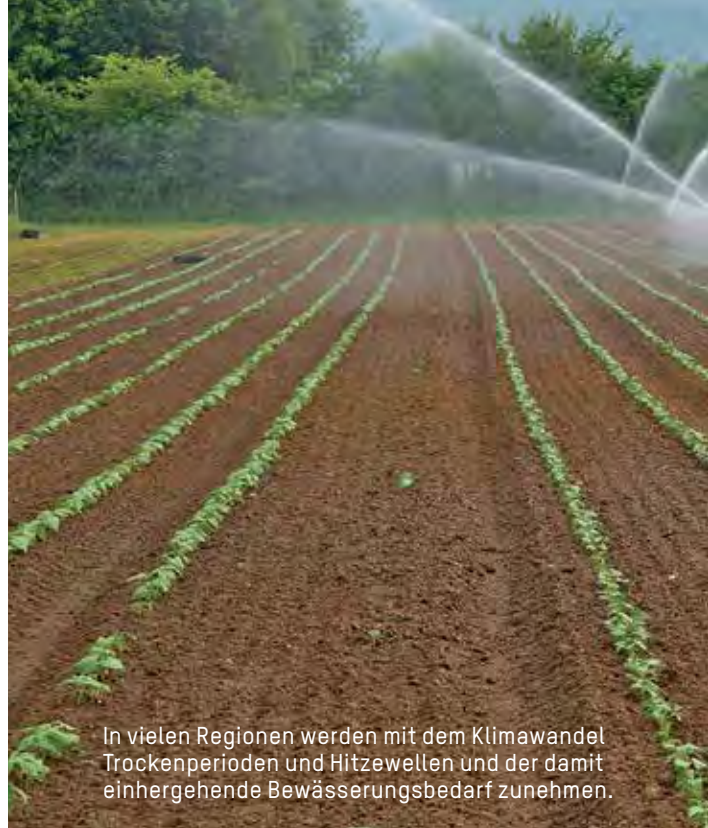
In vielen Regionen werden mit dem Klimawandel Trockenperioden und Hitzewellen und der damit einhergehende Bewässerungsbedarf zunehmen.