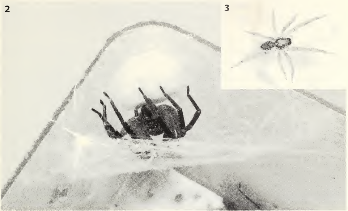
Abb. 2-3: Zoropsis spinimana, (2) Weibchen mit Kokon, und (3) ein am 7.4.2006 geschlüpf-tes Jungtier nach der 2. Häutung