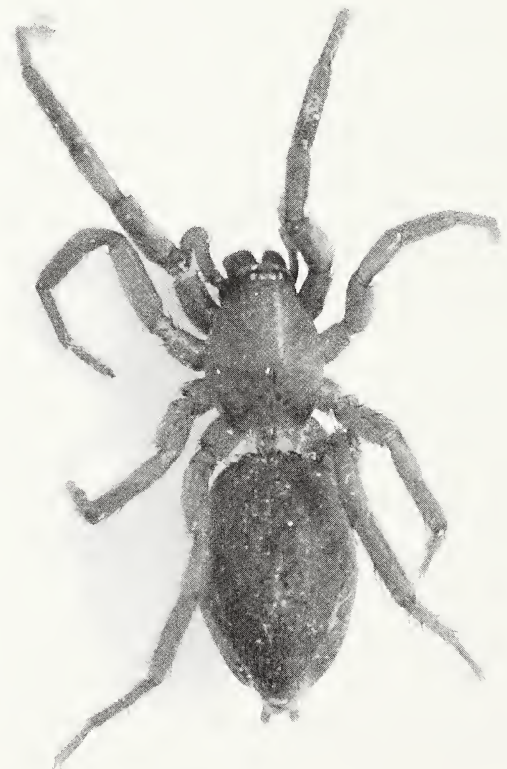
Abb. 1: Zelotes tenuis (L. Koch, 1866), adultes Weibchen, Fundort nahe Leithaprodersdorf. Maßstab: 2 mm.

Bestimmung: CHATZAKI et al. (2003), DELTSHEV (2003), LEVY (1998), MELIC (1994). Bezüglich der Taxonomie wird auf PLATNICK & SHADAB (1983) verwiesen.