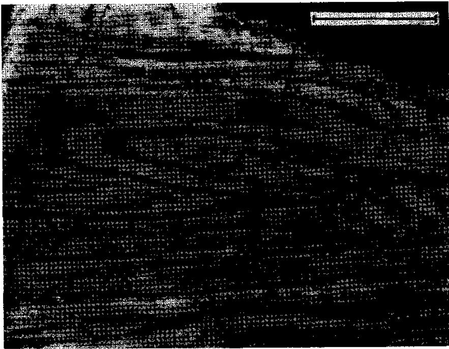
Abb. 3. Isoklinal gefalteter Manganquarzit (Anschliff). Q = quarzreiche Lage; G = granatreiche Lage; Maßstab: 1 cm. Fundort: N St. Urban/Laaken (Probe 27—2).

Der Wechsel von spessartinreichen und spessartinarmen Lagen kann nur als primärer Wechsel von manganreichen und verhältnismäßig manganarmen Lagen im Edukt gedeutet werden. Dieses primäre „s“ ist prä- bis paraganatisch mindestens einmal, zum Teil deutlich zweimal gefaltet worden: Erste Falten sind die häufigen relativ spitzen, liegenden Isoklinalfalten in verschiedenen Größenordnungen, mit denen auch gelegentlich Zerschierung des „ss“ verbunden sein kann (Abb. 3). Zweite Falten verbiegen die ersten, zum Teil auch wieder isoklinal. Diese Gefüge sind aber jedenfalls kleinräumig und „Plankogelserien-intern“, so daß der Manganquarzit mit Sicherheit als stratiform bezeichnet werden kann.