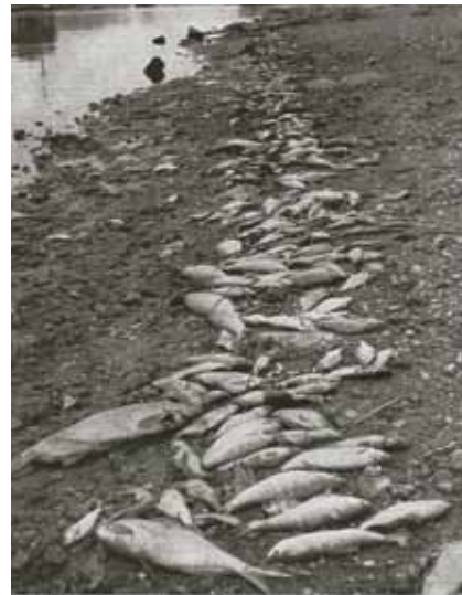
In Wien standen überwiegen Teilnehmer der Partei für die Arbeit mit dem Namen „Österreichischer Natur- und Landschaftsschutz“

Im Anschluss an die Gründungsversammlung folgte bereits die erste Arbeitssitzung, bei welcher die Hauptanliegen des Naturschutzes in Oberösterreich eingehend beraten wurden. Neben der alarmierenden Verbauung und Versperung der Seeufer beklagten die Teil-